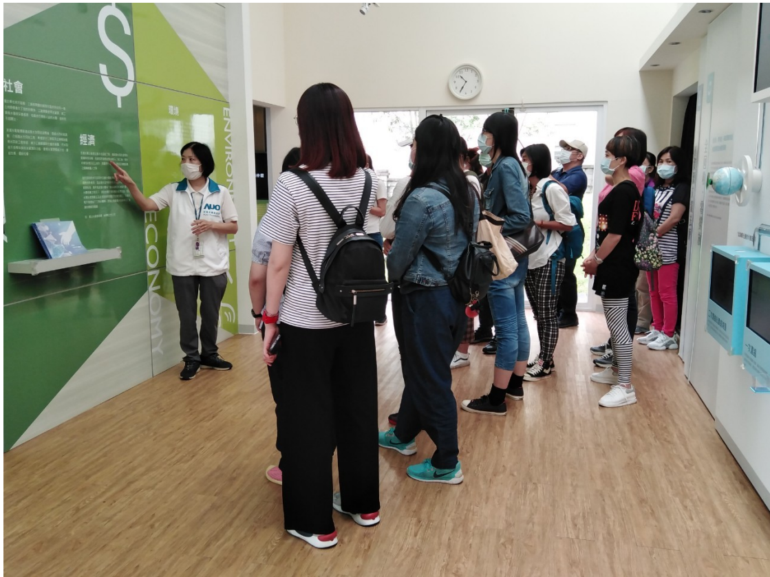
製程用水全回收零排放的源起說明