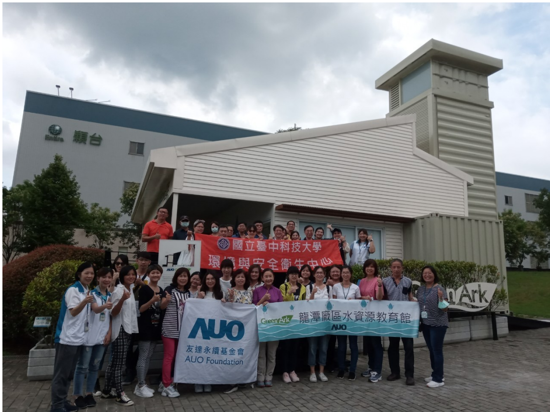
AUO GreenArk 水資源教育館前參加者合影