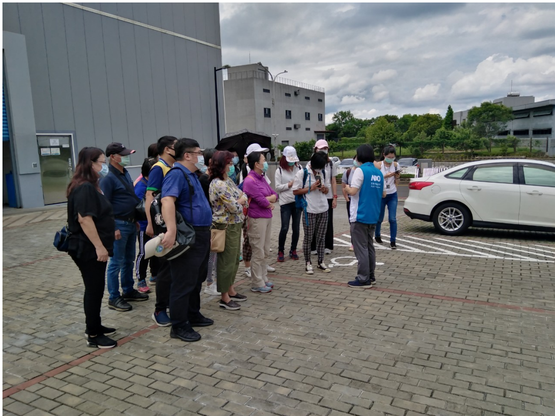
導覽者自我介紹及水資源教育館創立說明