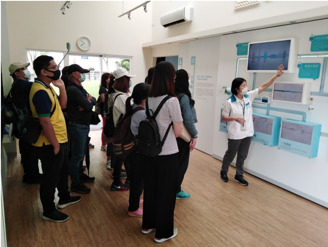
製程用水全回收零排放的處理流程解說