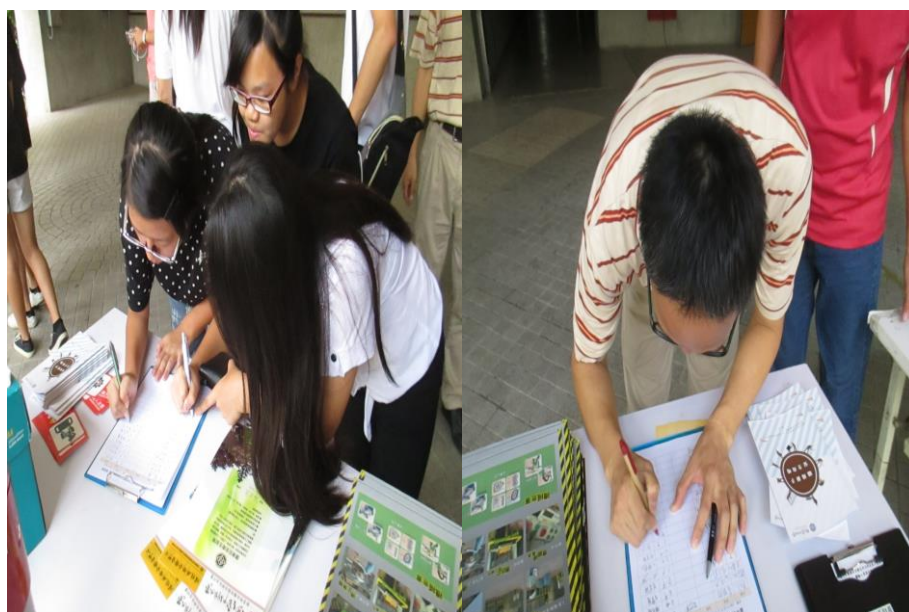
參加教職員工生簽到