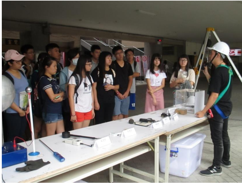
作業環境監測儀器使用說明