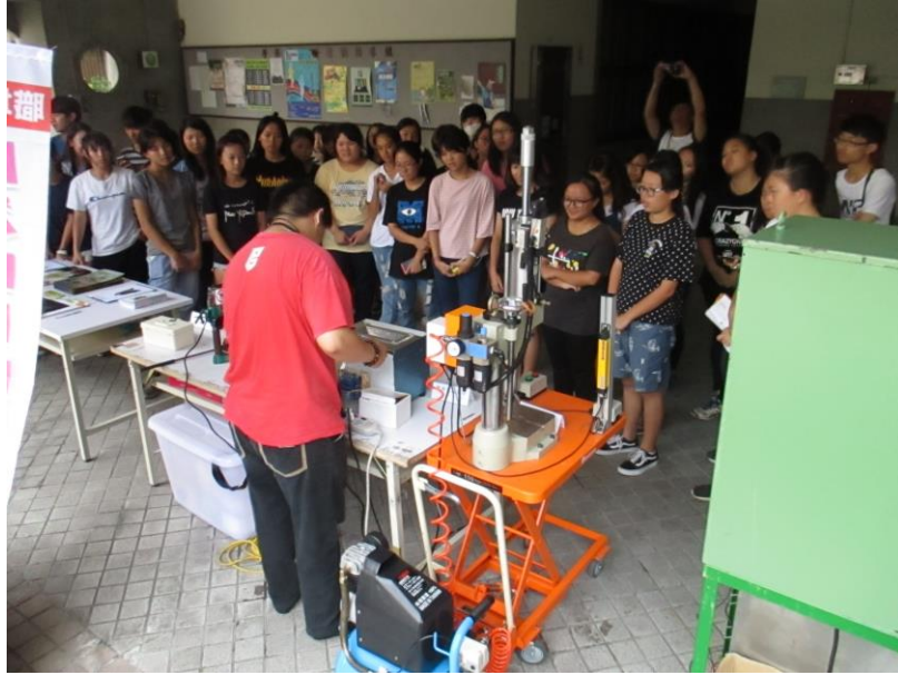
機械危害(捲夾)說明