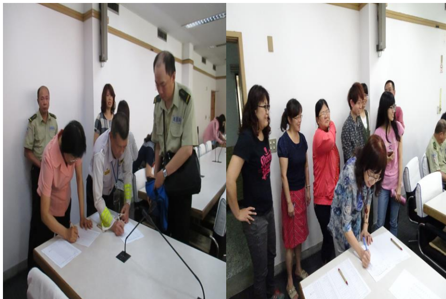
參加教職員工簽到