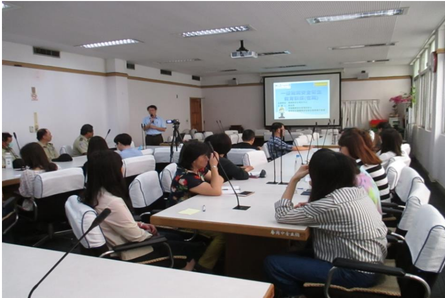
認真聆聽的教職員工