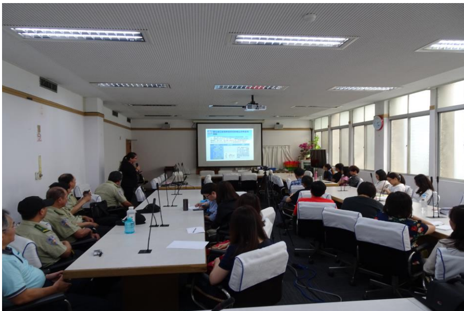
認真聆聽的教職員工