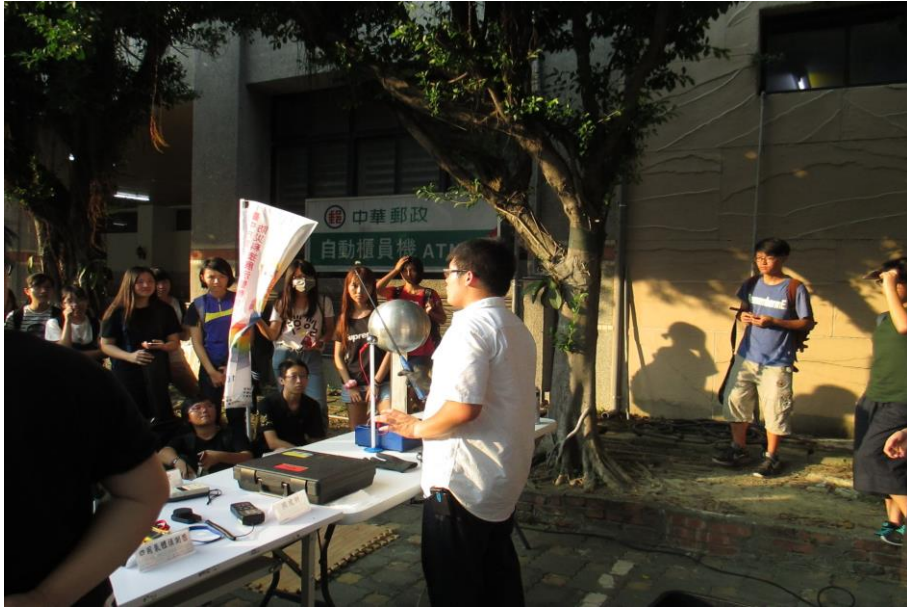
木工坊須戴帽作業說明