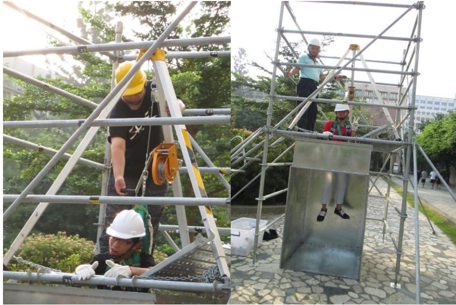
局限空間人員搭救示範