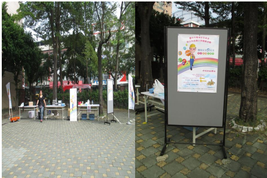
展示會場及活動海報張貼