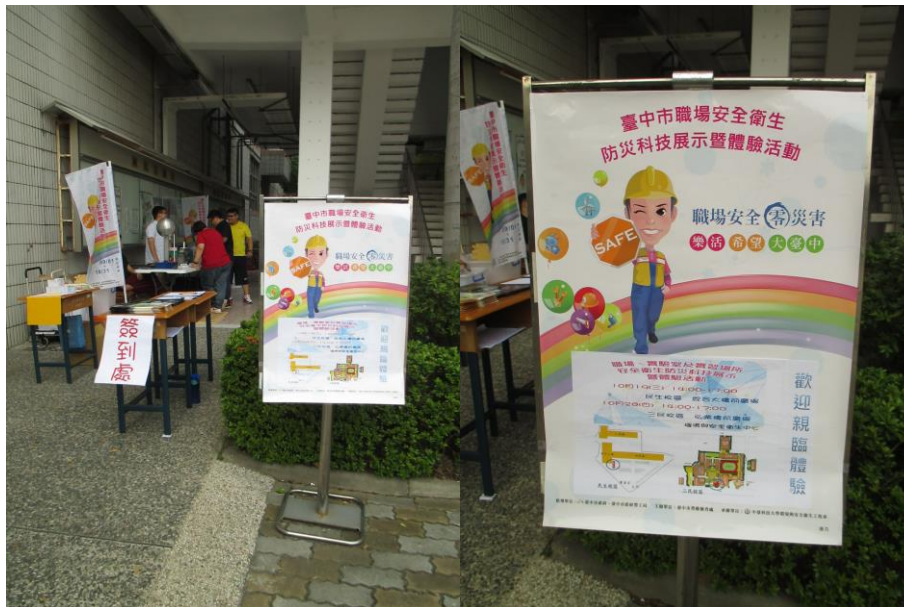
展示會場及活動海報張貼