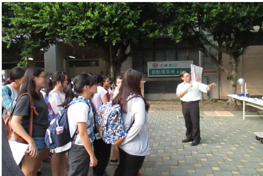
環境與安全衛生中心主任開場