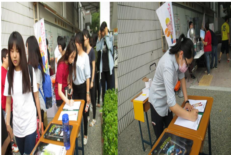
參加教職員工生簽到