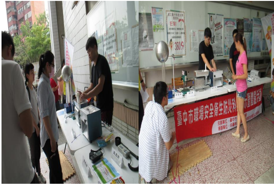
機械危害(捲夾)說明