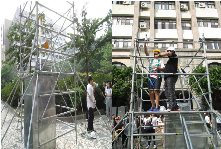
施工架危險注意事項說明及安全母索使用