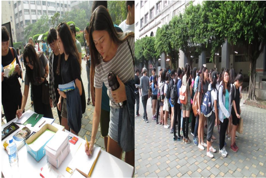
參加教職員工生簽到