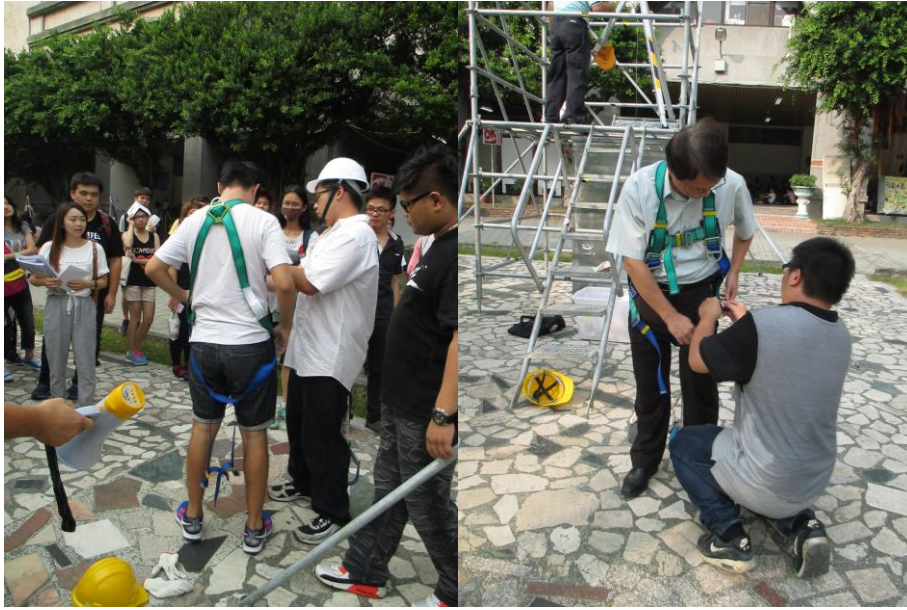
背負式安全帶穿戴示範