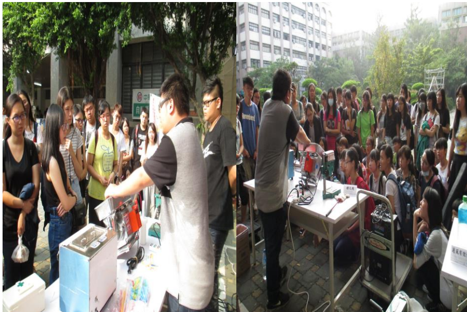
機械危害(捲夾)說明