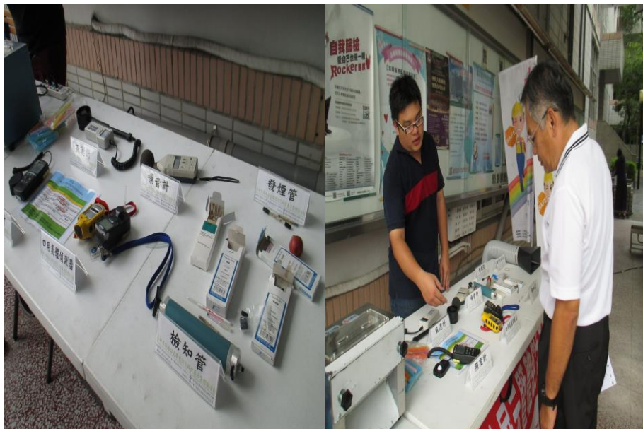
作業環境監測儀器使用說明