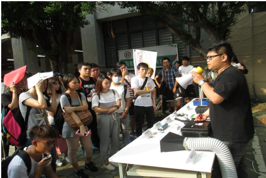
作業環境監測儀器使用說明