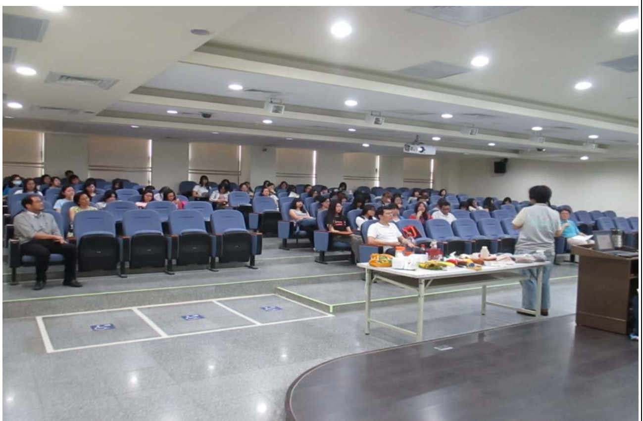
教職員、生聆聽演講-1