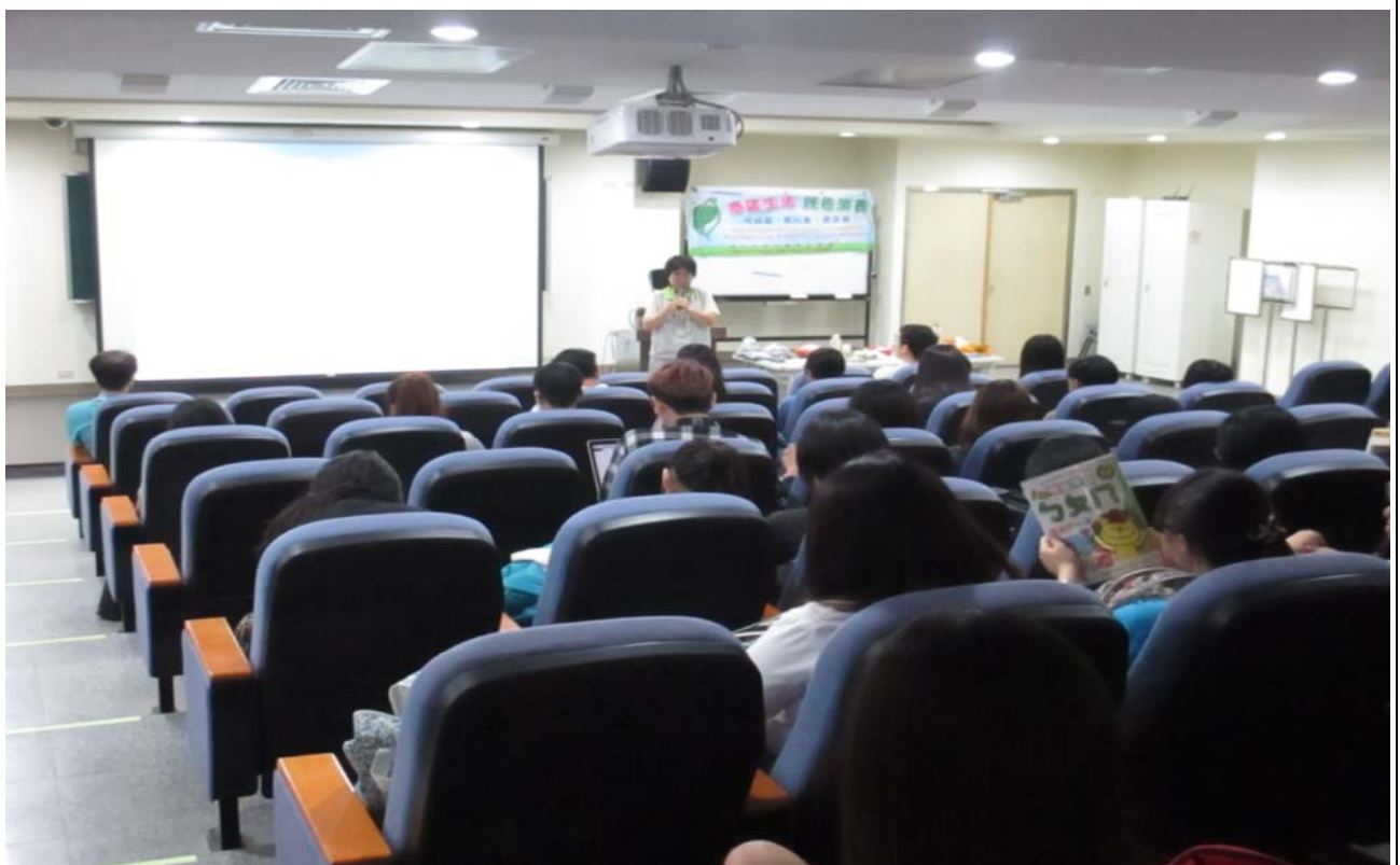
教職員、生聆聽演講-2