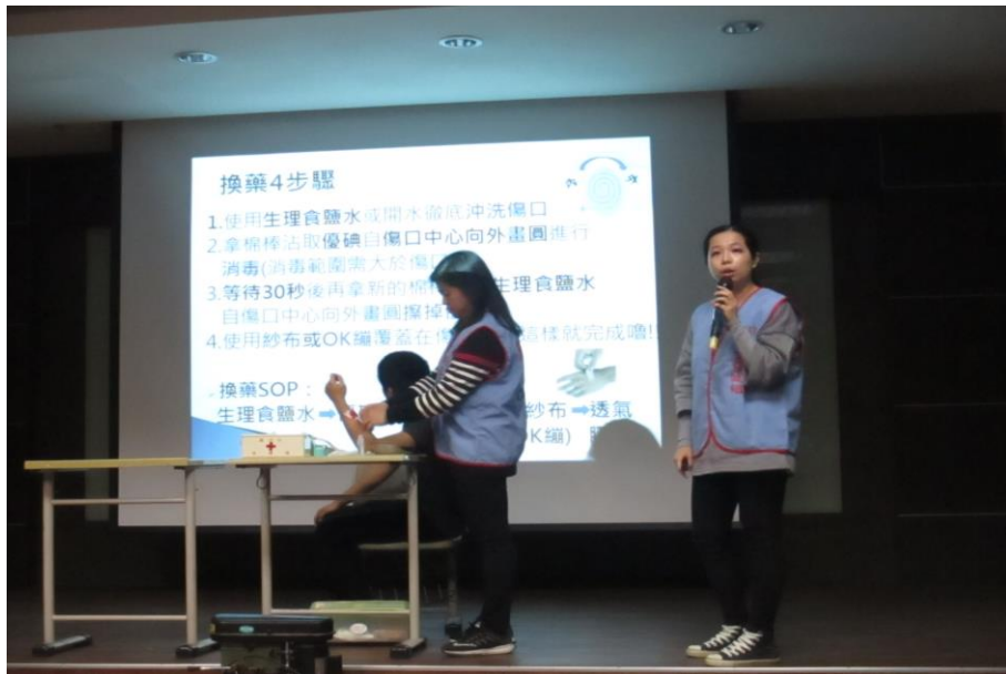
衛保組護理師說明傷口簡易處理及示範