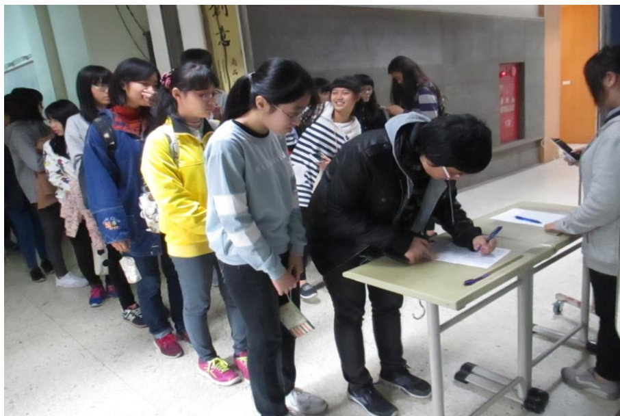
參加學生集合、簽到