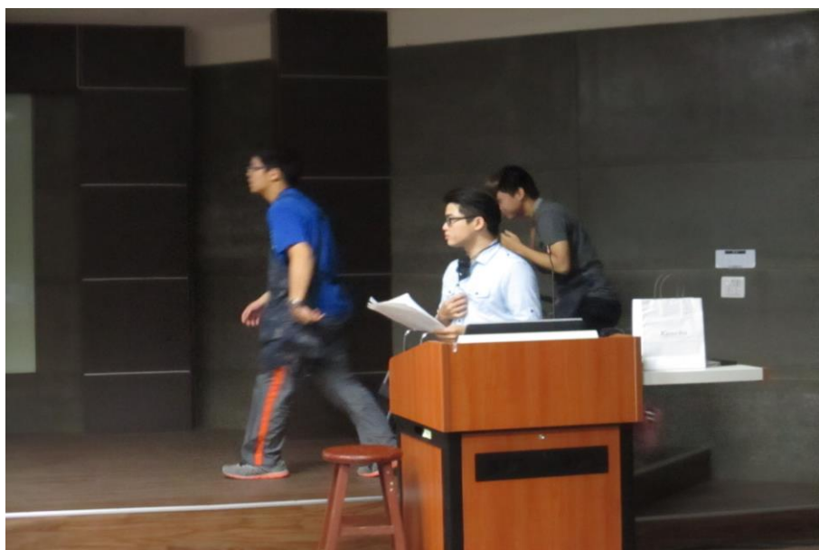
緊急應變演練開始前預演、準備