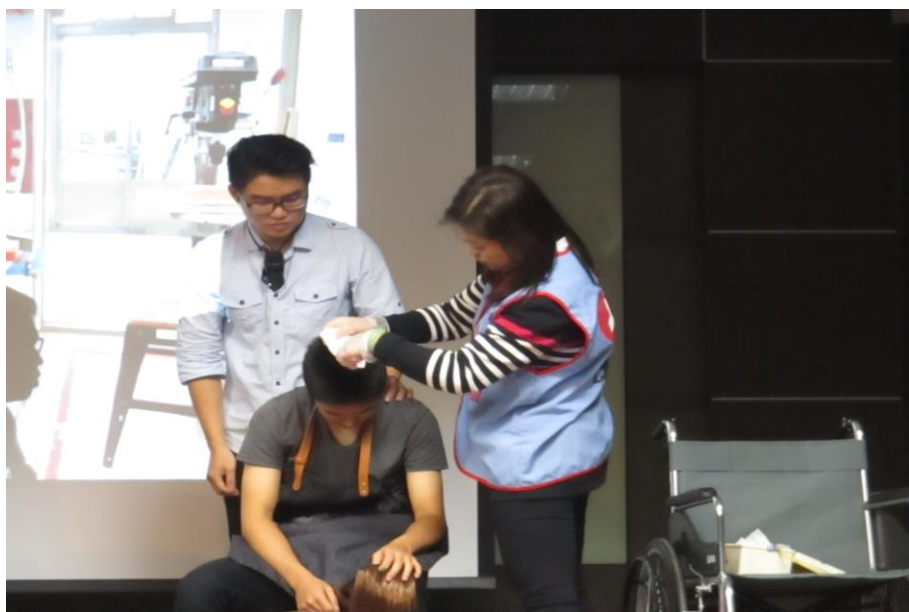
緊急應變演練－護理師進行清創處理，並評估是否呼叫救護車送醫