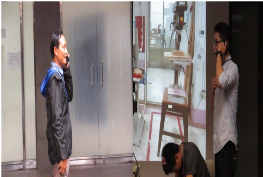
緊急應變演練－通報指導老師及衛保組護理師