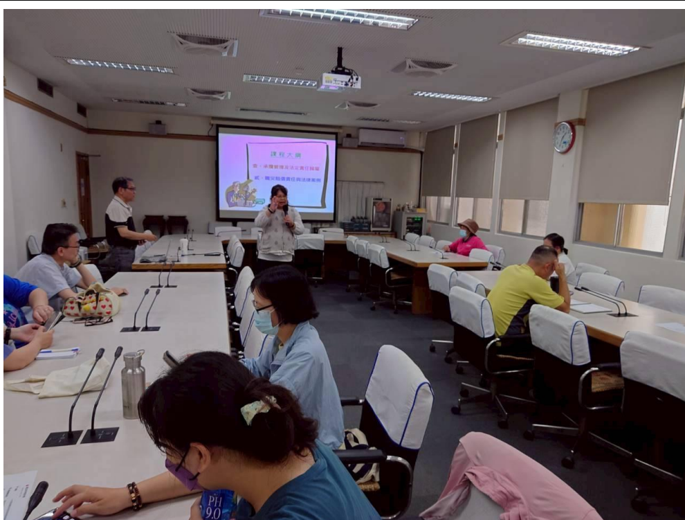
承辦介紹課程及講師