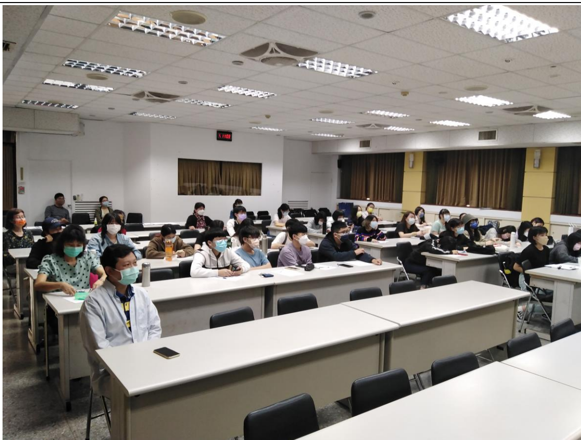
教職員工生聆聽演講-5