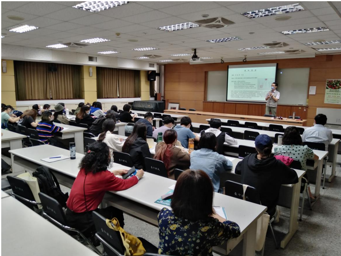
教職員工生聆聽演講-3