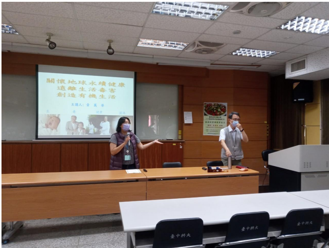
環境與安全衛生中心開場引言