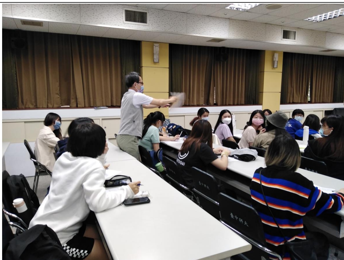
教職員工生嗅覺體驗各種食品添加物(香精)