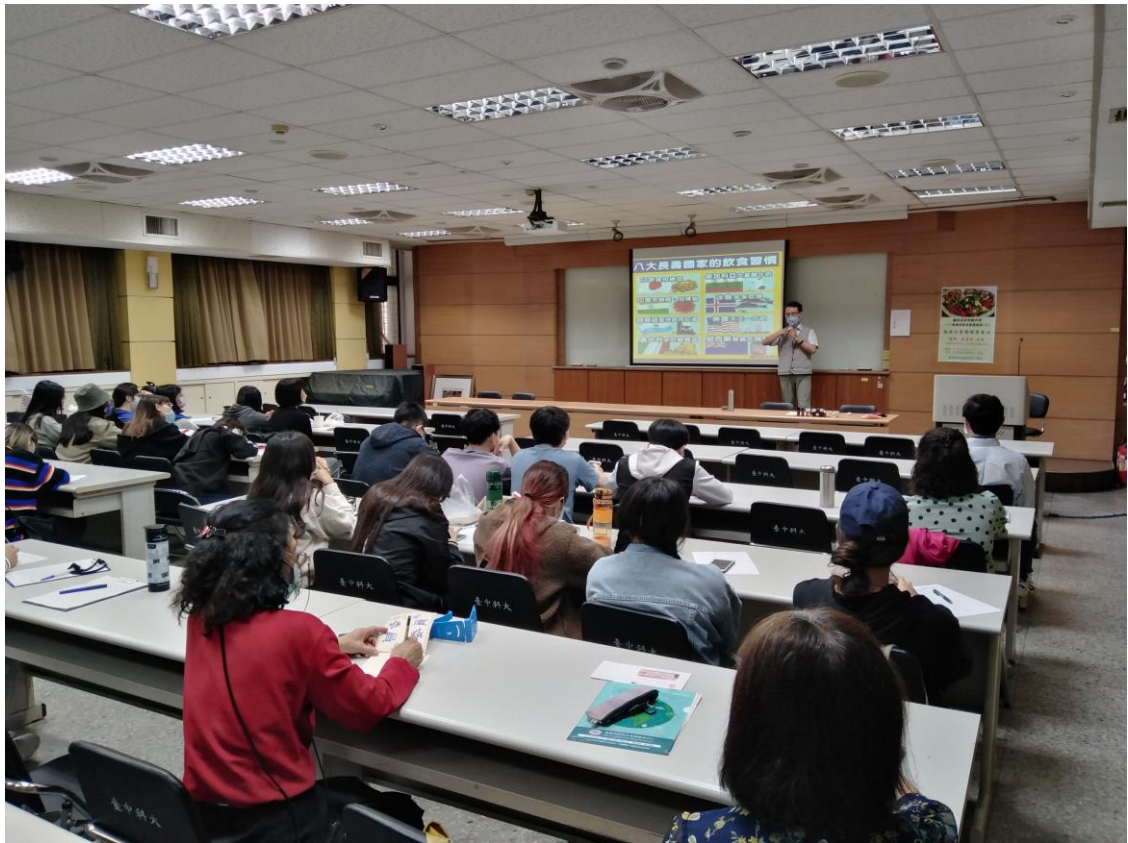
教職員工生聆聽演講-4