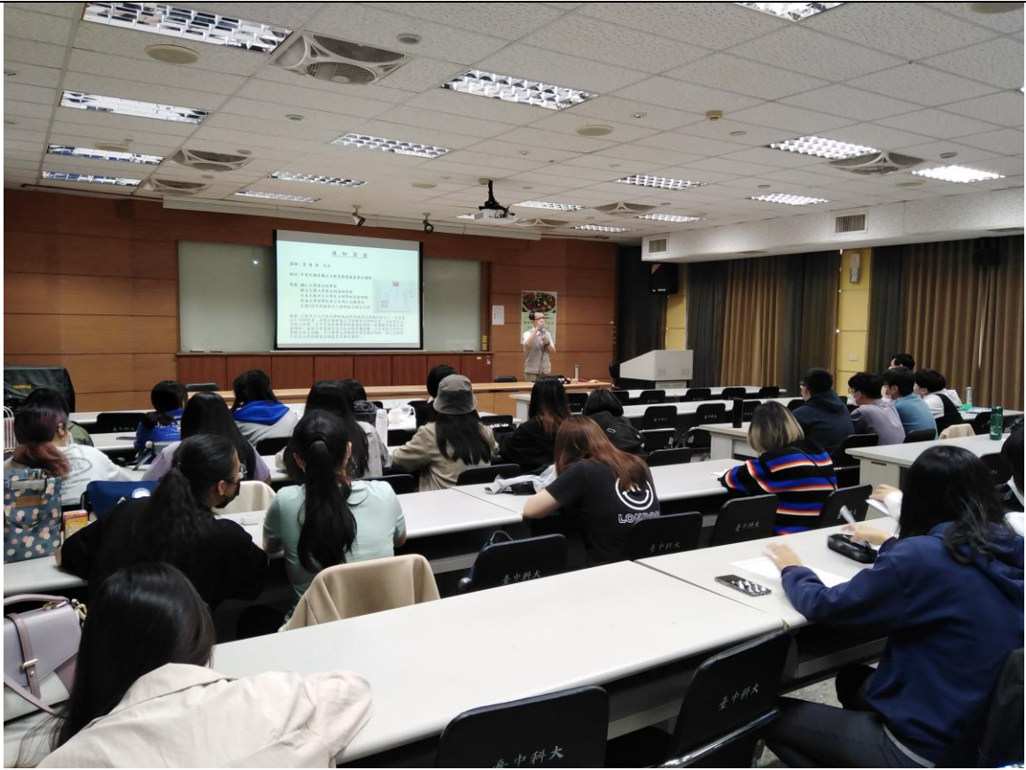
教職員工生聆聽演講-1