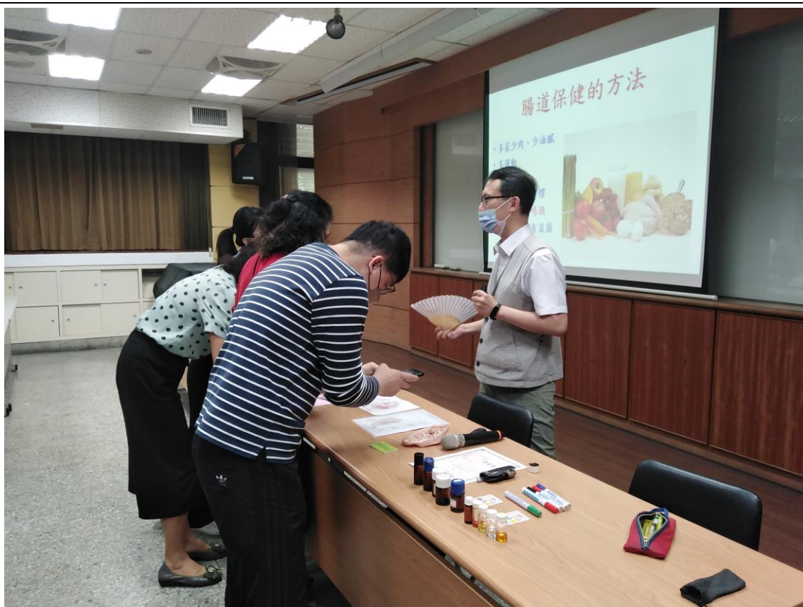
教職員工生於演講結束後與講師互動