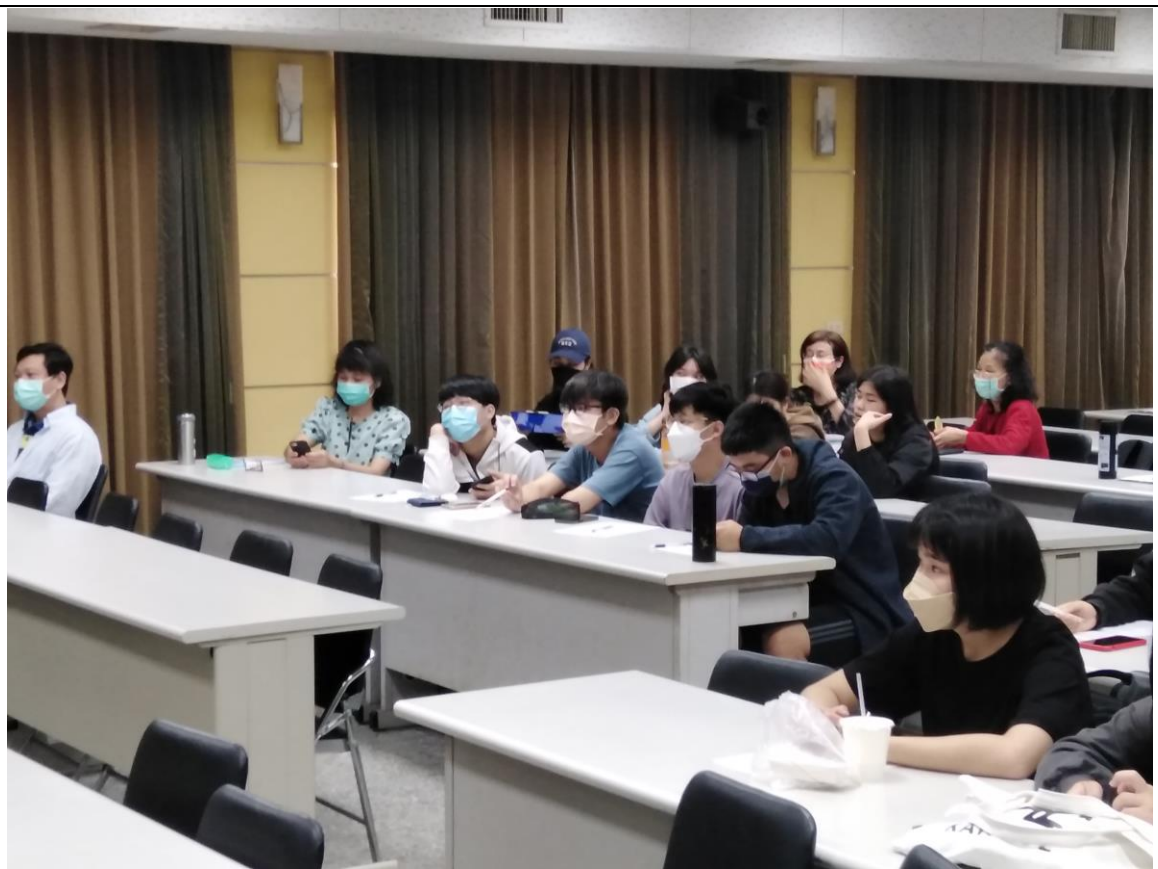
教職員工生聆聽演講-2