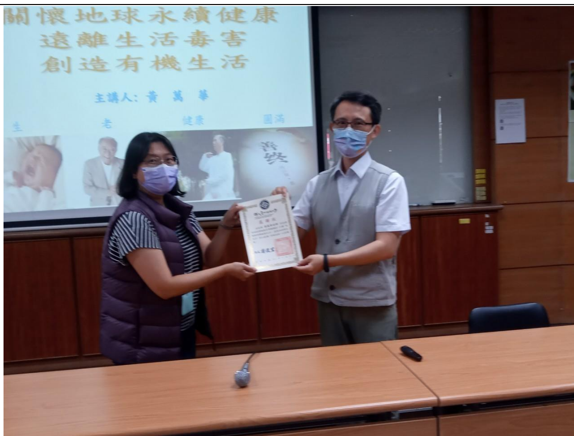
環境與安全衛生中心代表本校致贈感謝狀