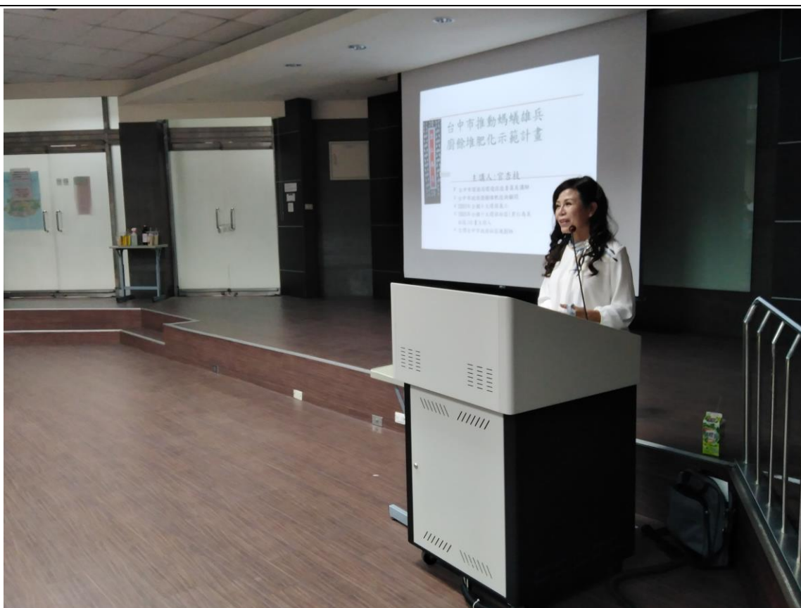
講師分享推動社區廚餘堆肥經驗