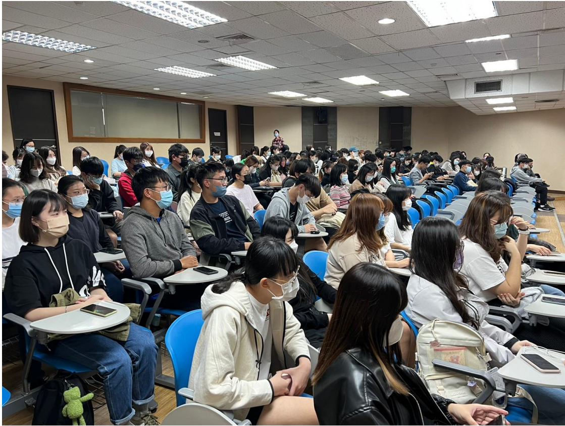
教職員工生聆聽演講-3