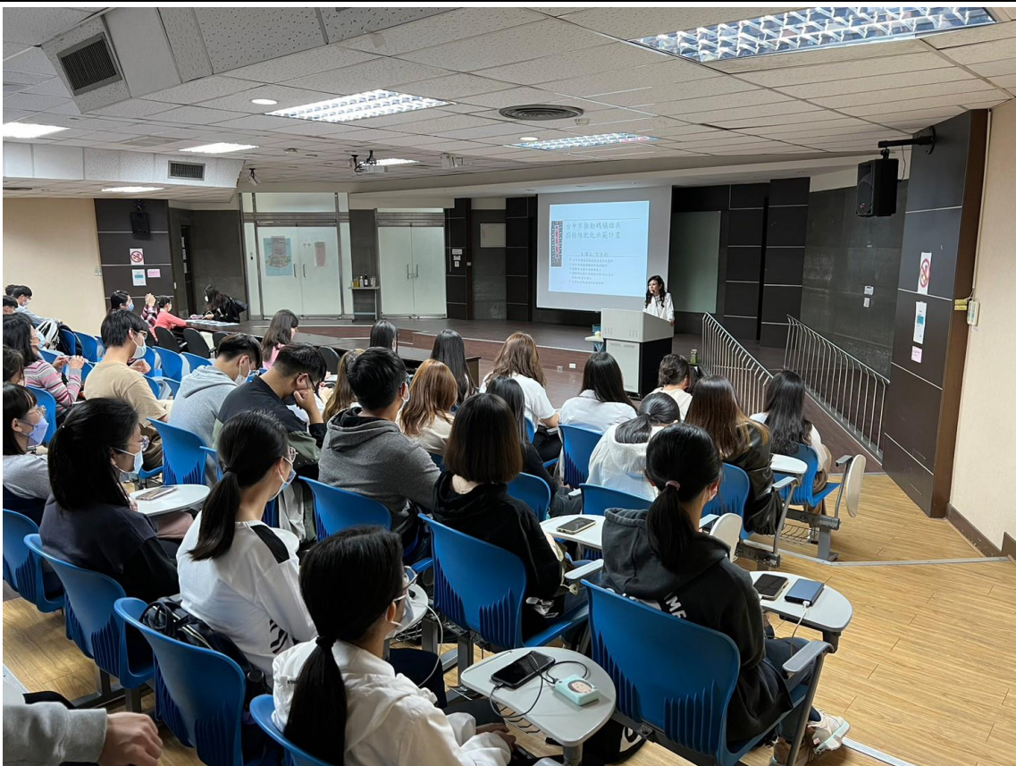
教職員工生聆聽演講-2