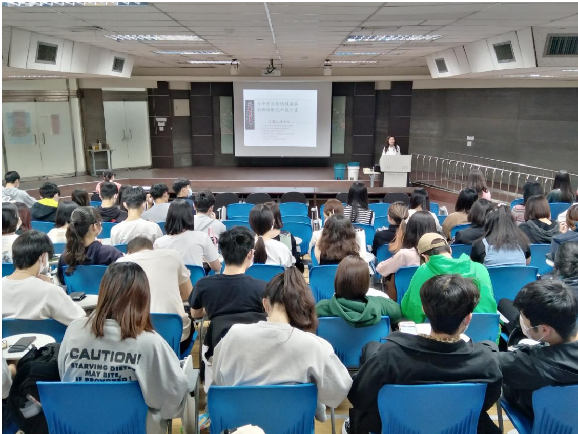
教職員工生聆聽演講-1