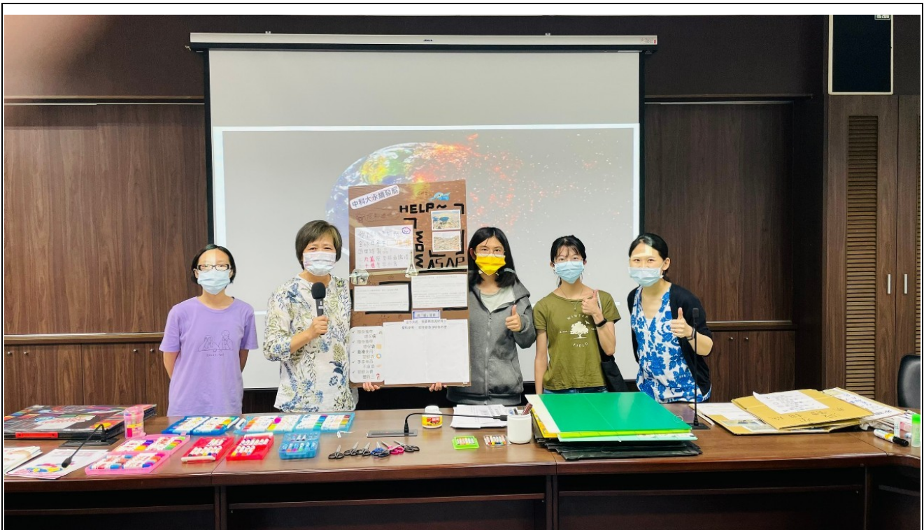
DIY 減廢宣言板成果展示-5