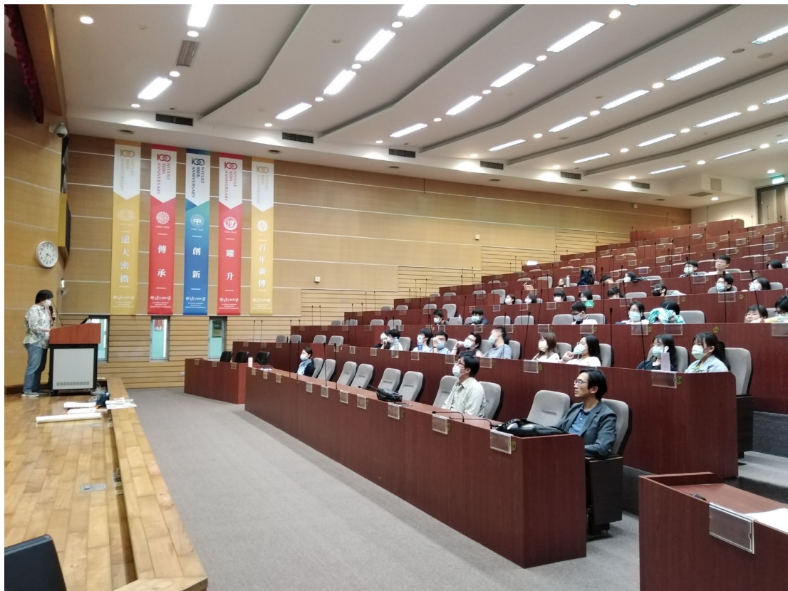
教職員工生聆聽演講-2