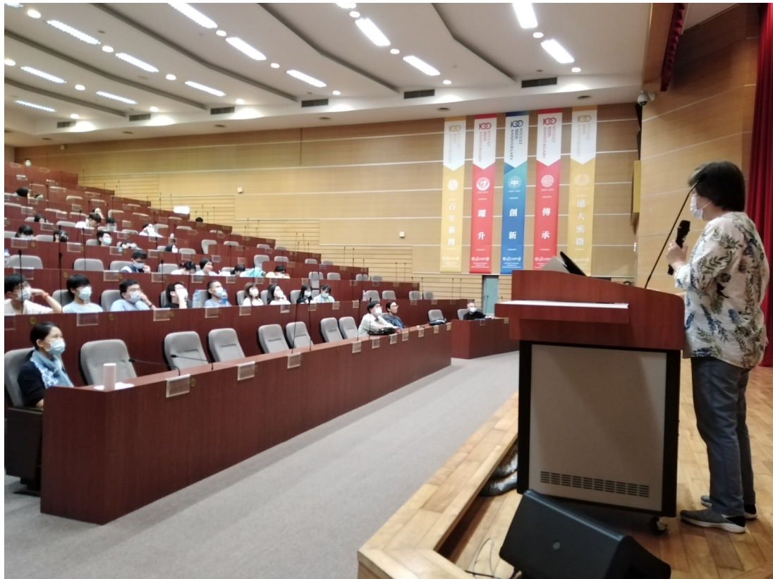
教職員工生聆聽演講-1