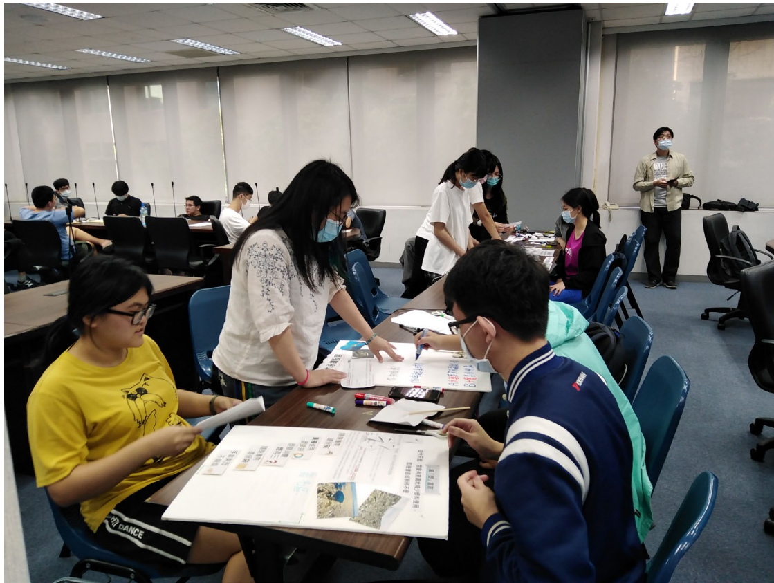
DIY 減廢宣言板實作現場-2