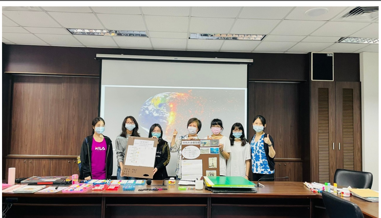
DIY 減廢宣言板成果展示-3