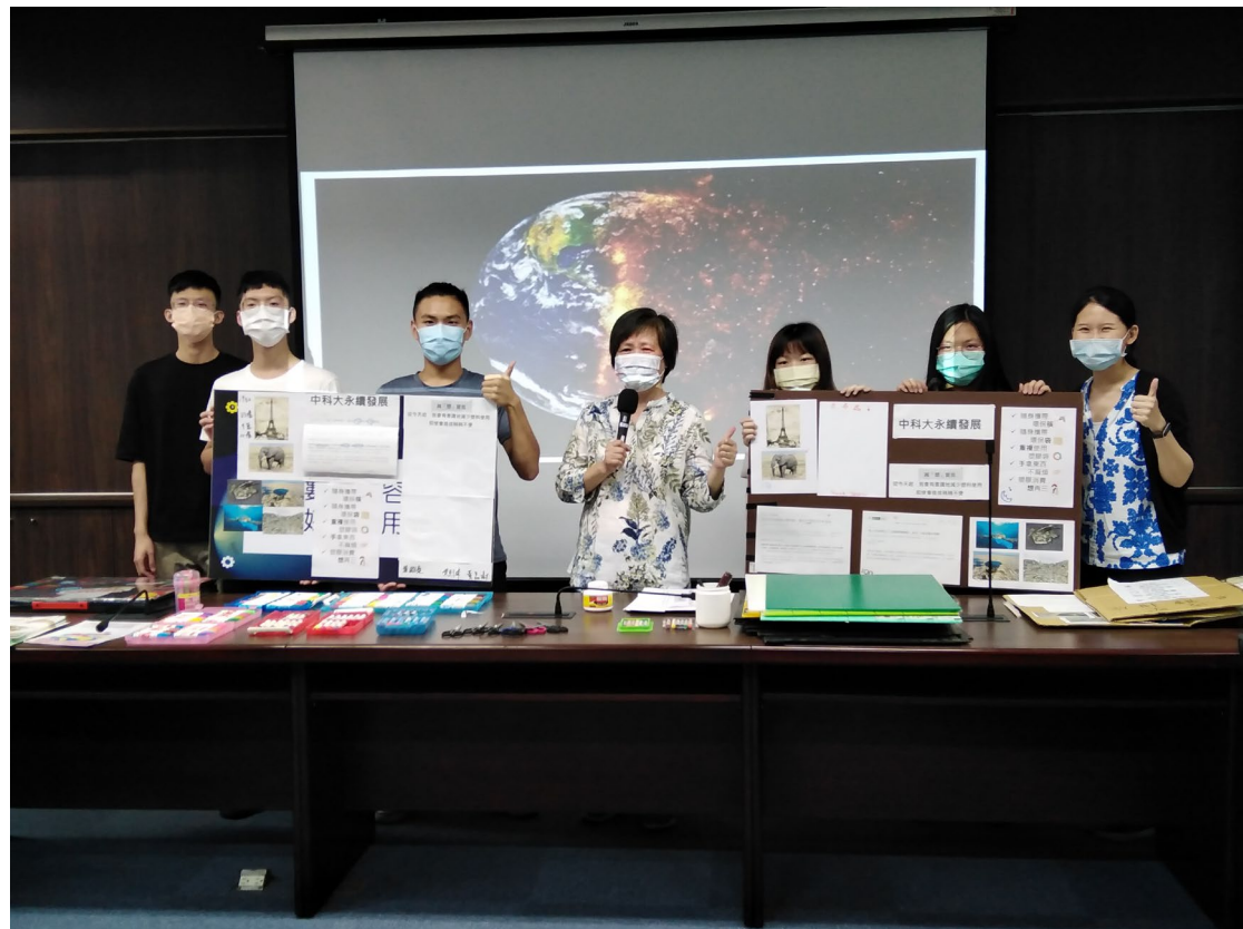
DIY 減廢宣言板成果展示-2