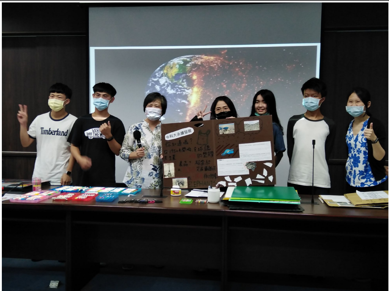
DIY 減廢宣言板成果展示-4