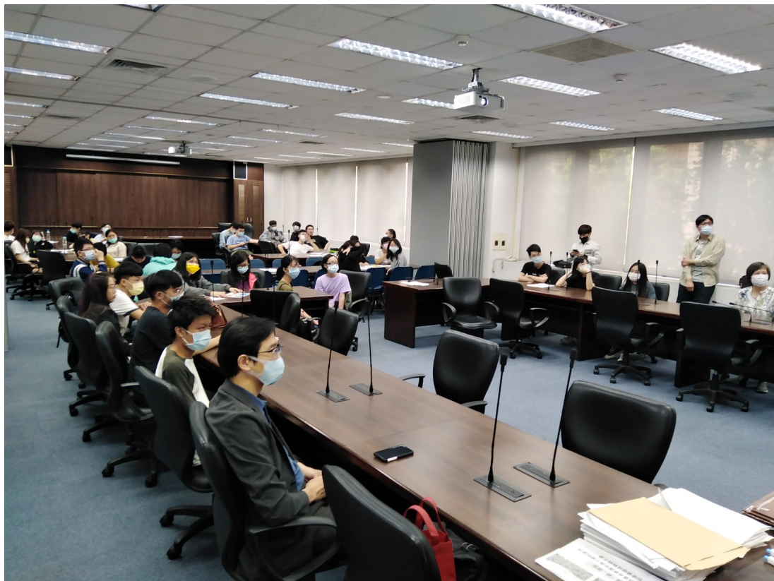
教職員工生聆聽製作DIY減廢宣言板之步驟