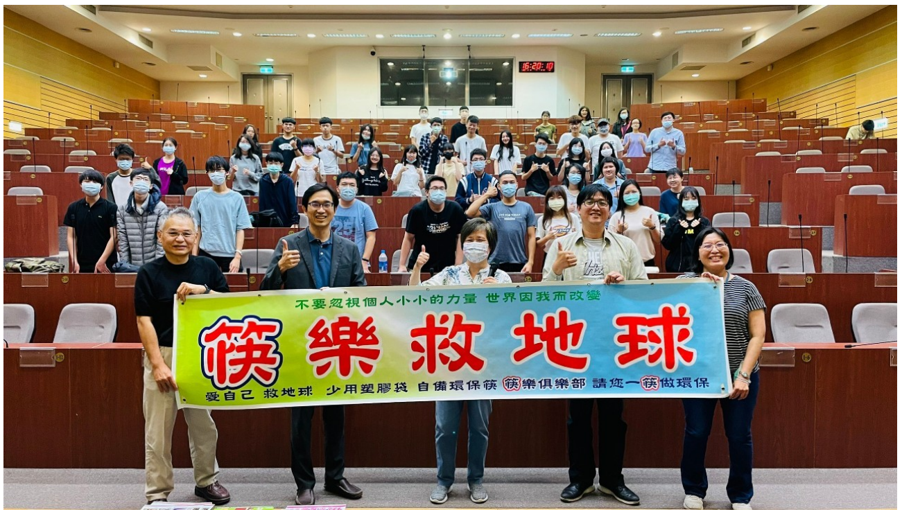
演講後全體大合照