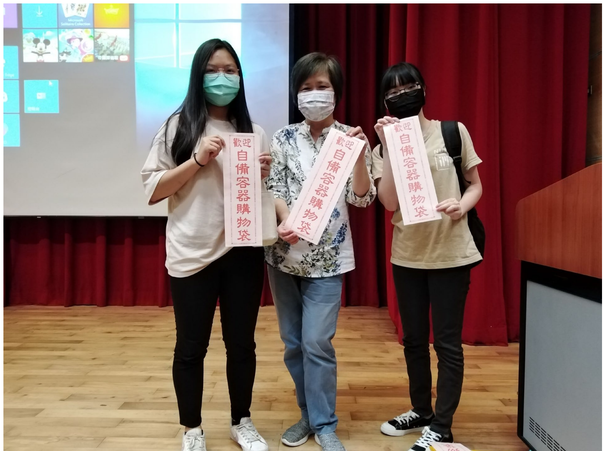
與會者與講師合照