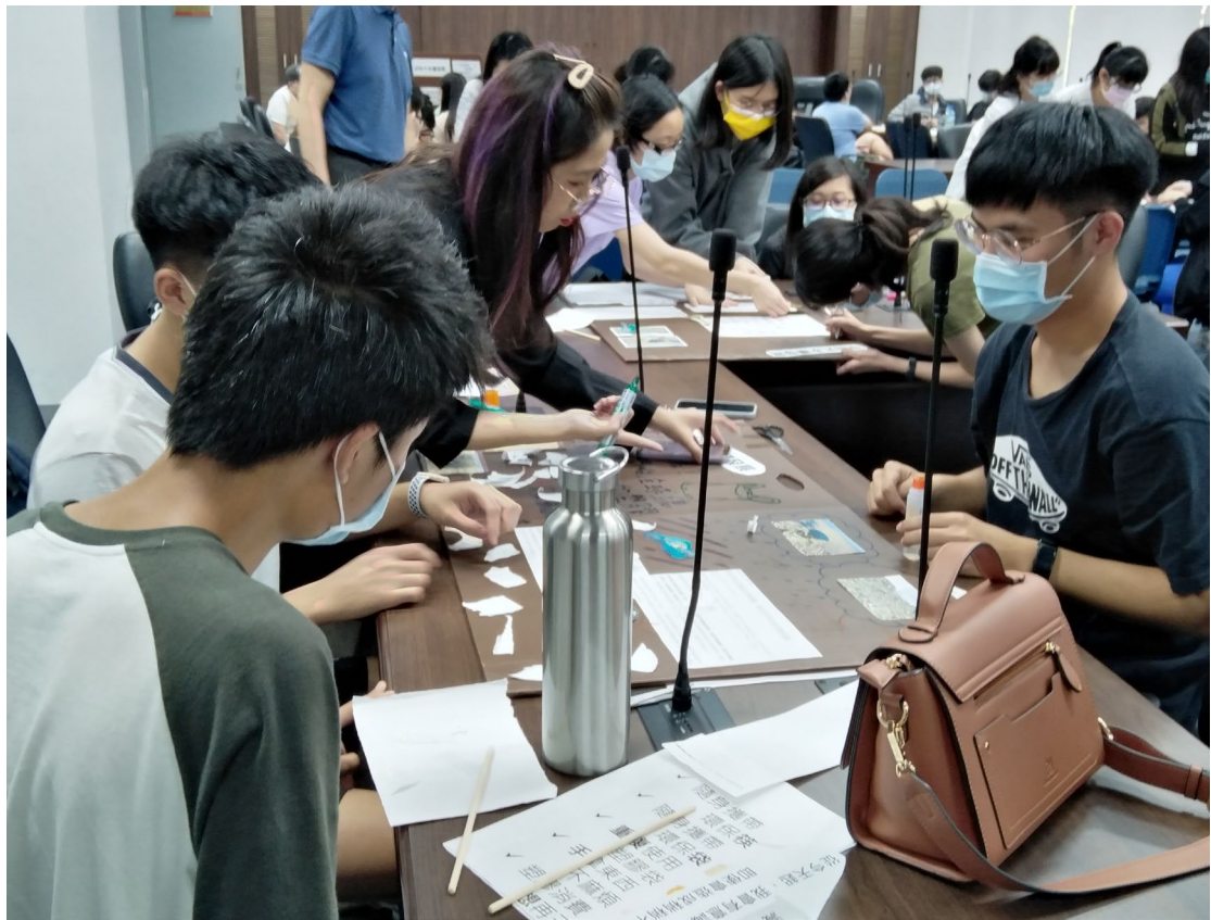
DIY 減廢宣言板實作現場-1