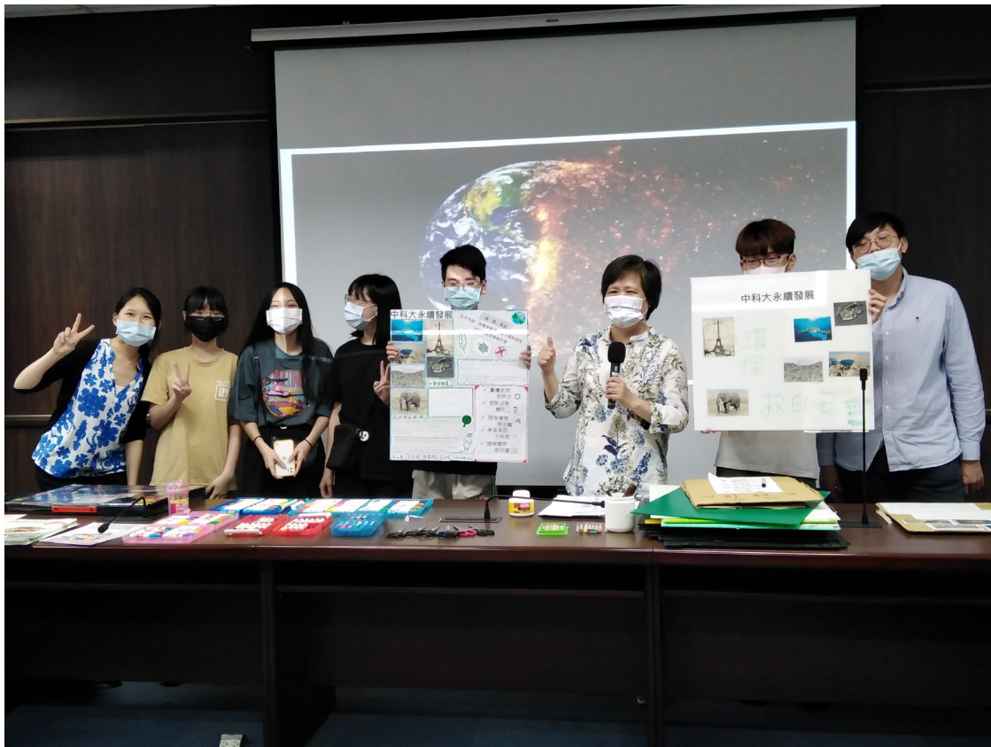
DIY 減廢宣言板成果展示-1