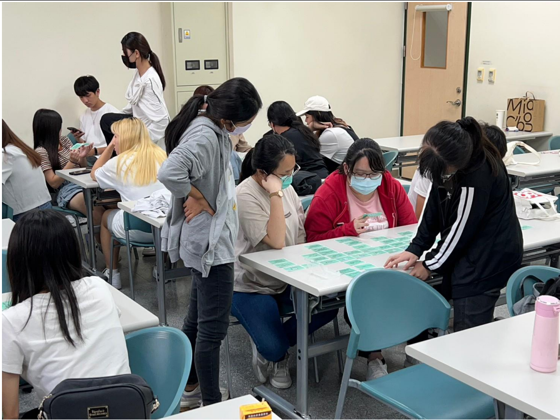
分組進行桌遊互動-2