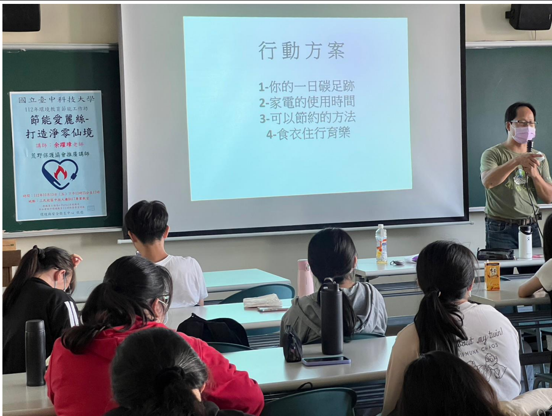
教職員工生聆聽演講-3