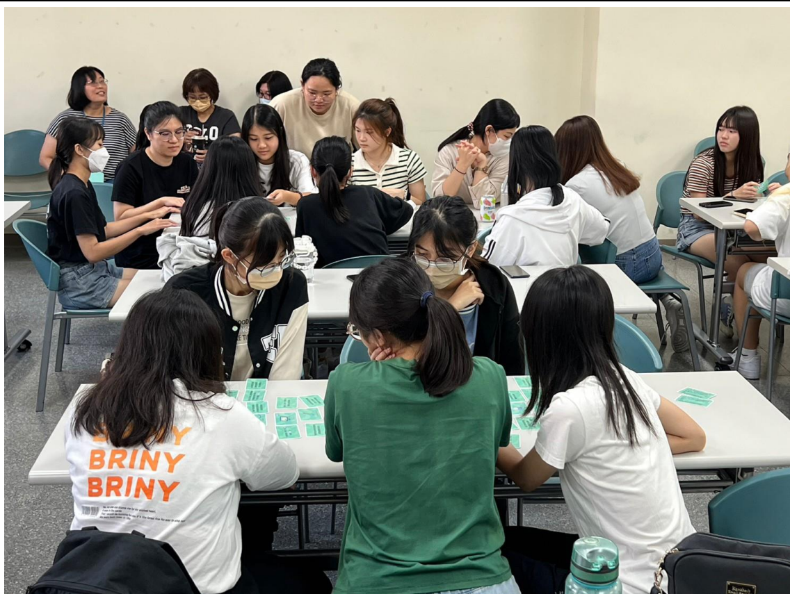
分組進行桌遊互動-1