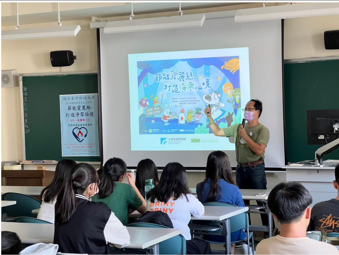
教職員工生聆聽演講-1