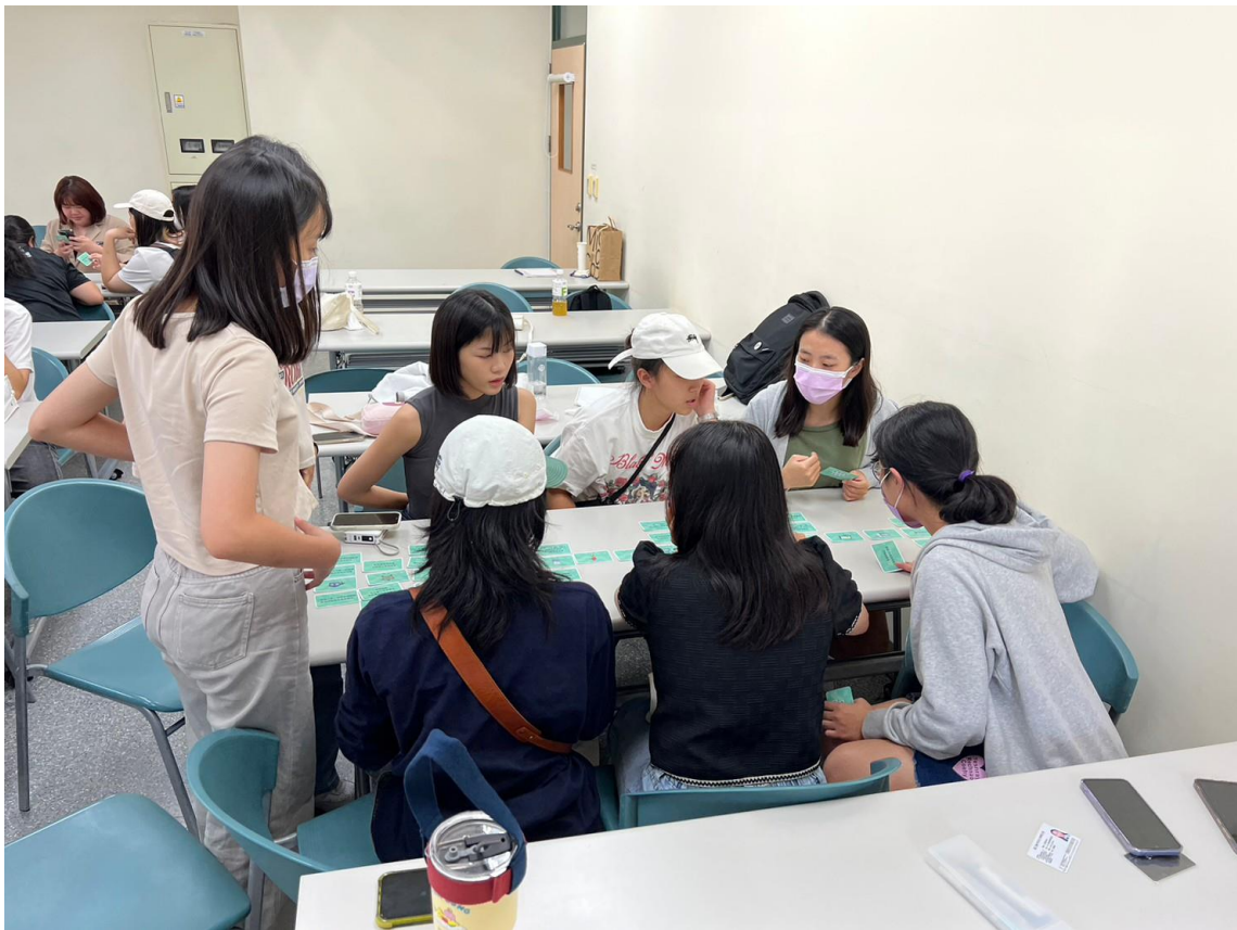
分組進行桌遊互動-3