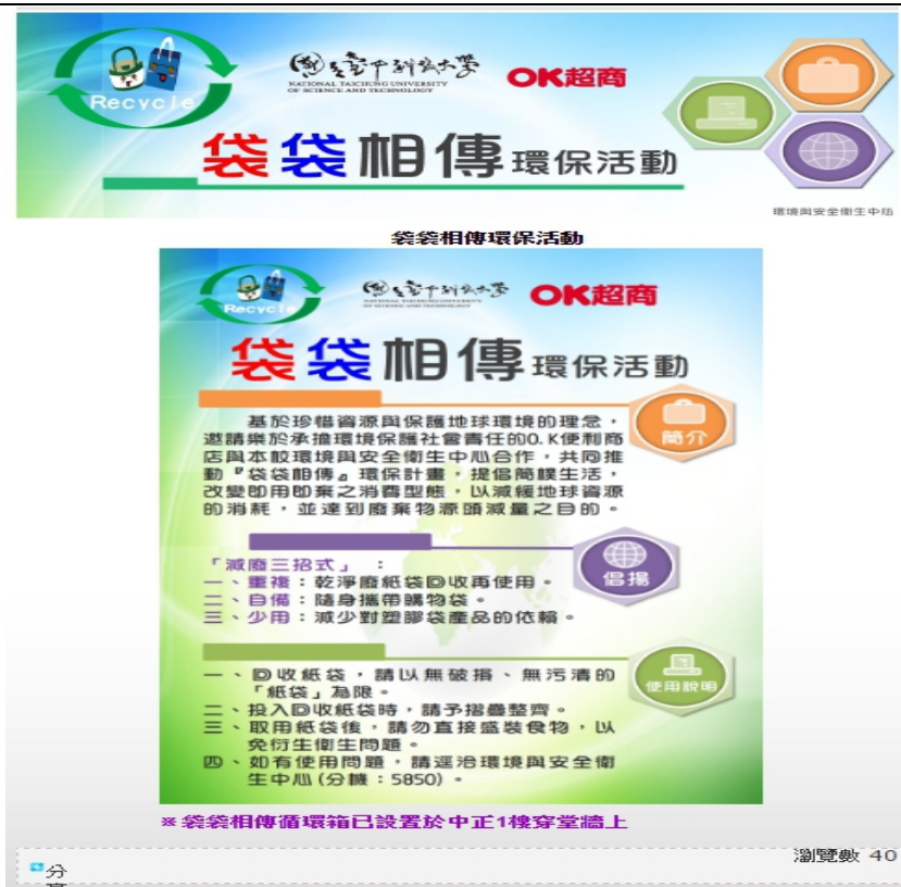
袋袋相傳環保活動之學校網站截圖