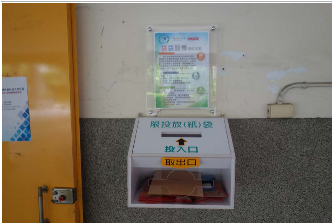
回收紙袋箱及簡介說明-1