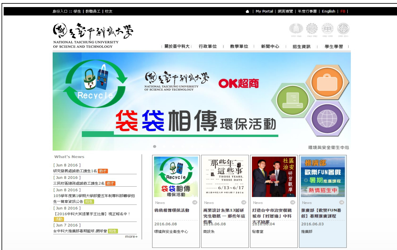
袋袋相傳環保活動之學校首頁截圖