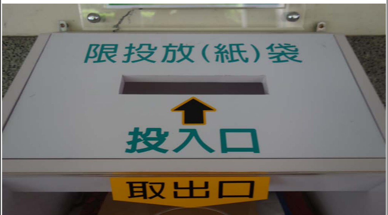
回收紙袋箱投入口-4