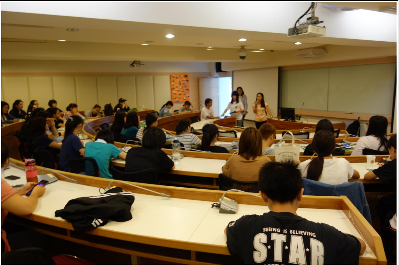
教職員、生聆聽演講-1