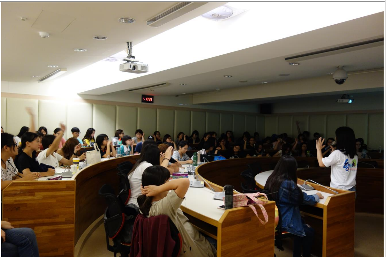
教職員、生聆聽演講-2