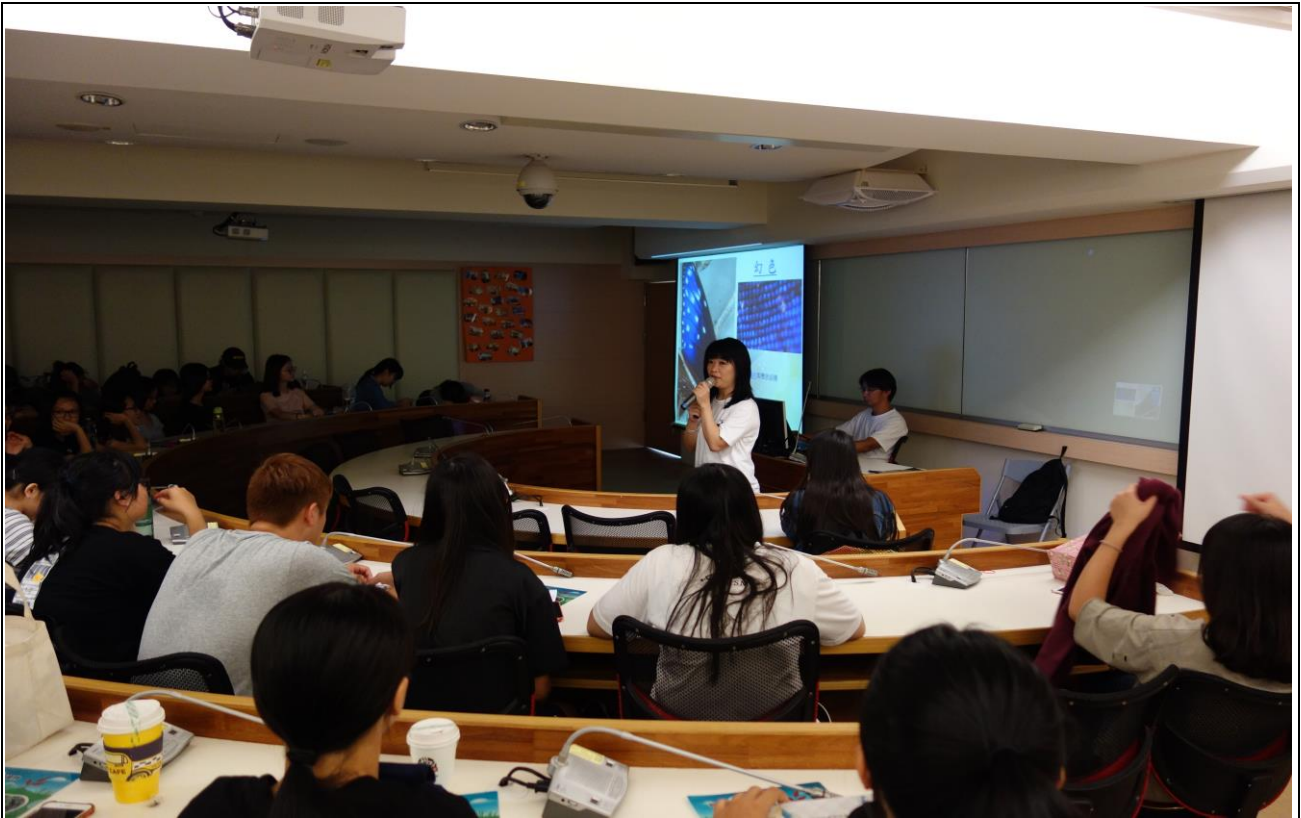
講師專題內容-生態教育宣導