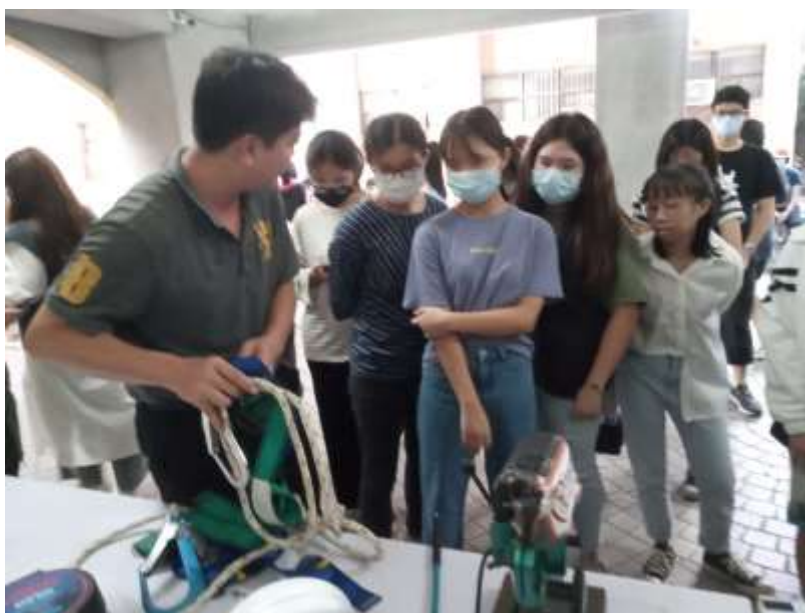
背負安全帶穿著示範及功能說明