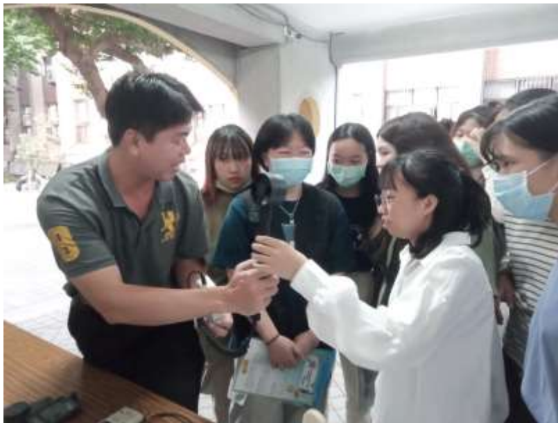
風速計操作及應用說明