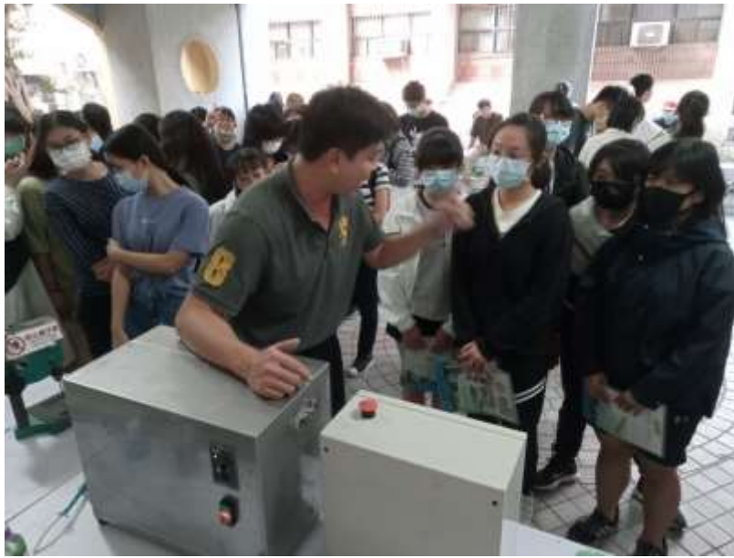
機械夾捲及高溫作業說明