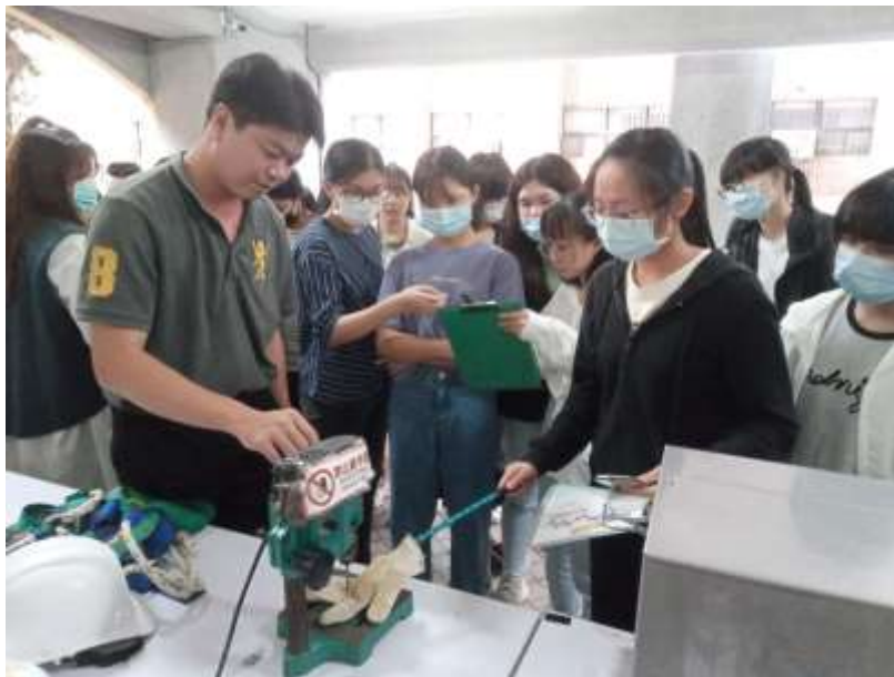
機械夾捲體驗及說明