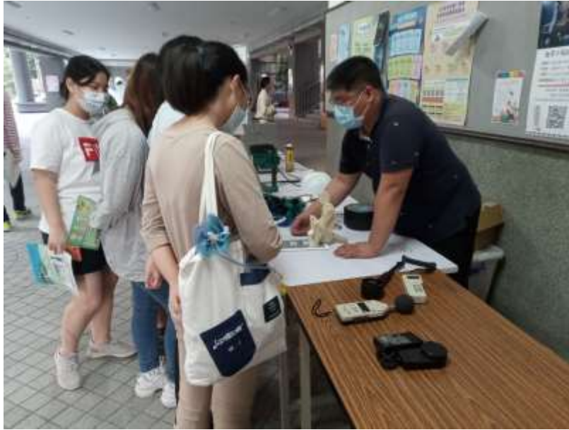
人工工程模型示範與簡介