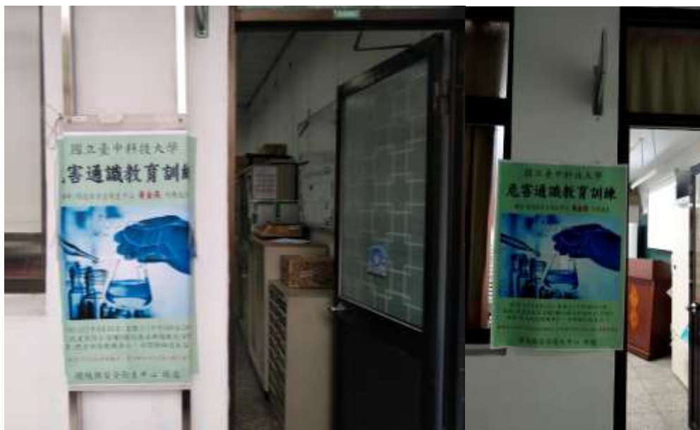
本次教育訓練海報、公告