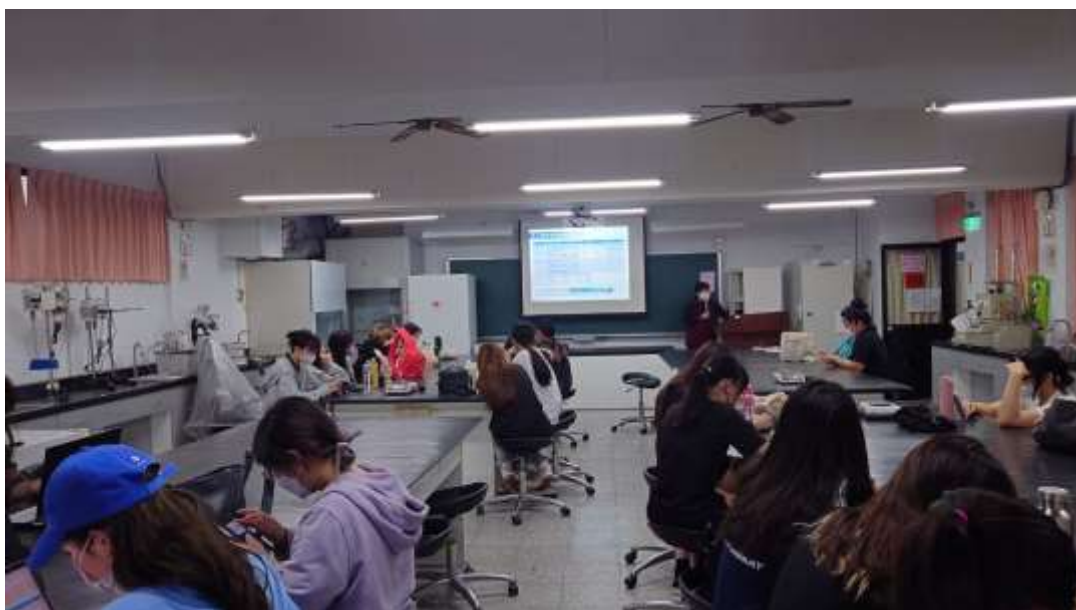
教育訓練上課情形