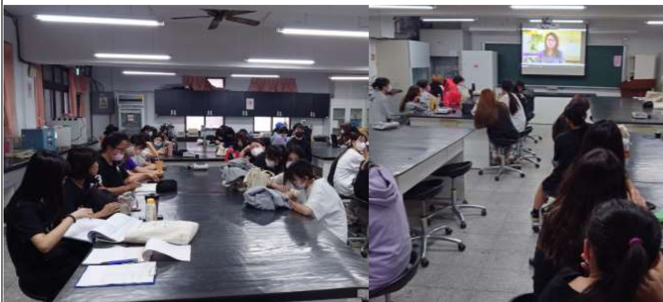
教育訓練上課情形