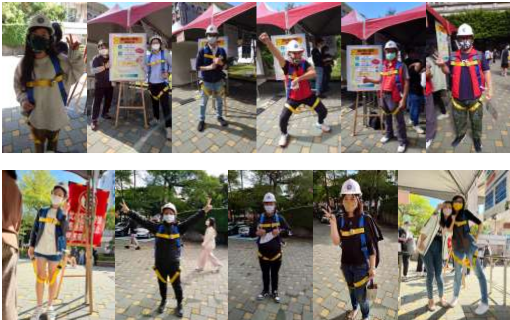
第 2 關環安衛體驗趣-穿著背負式安全帶體驗