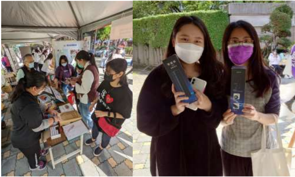
過關打彈珠拿禮物