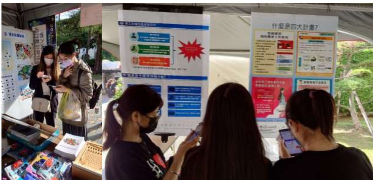
第 1 關健康問答闖關