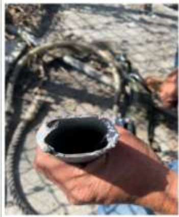
說明 斷裂之踏梯兩側斷裂面