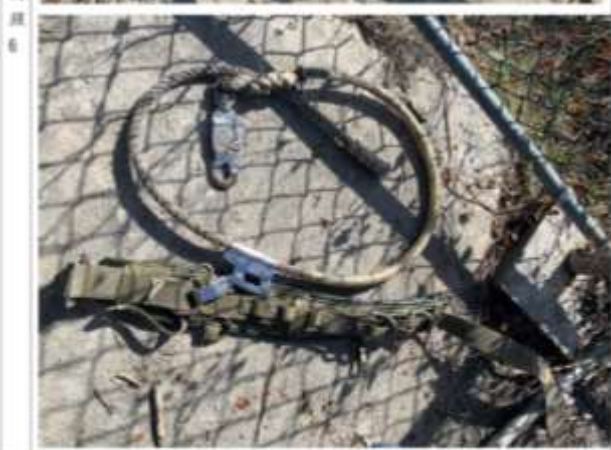
說明 現場遺留罹災者配戴之安全帽、背負式及腰掛式安全帶。