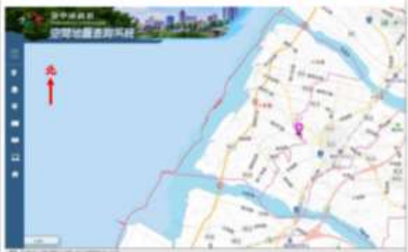
說明 臺中市大甲區光明段 830 地號。