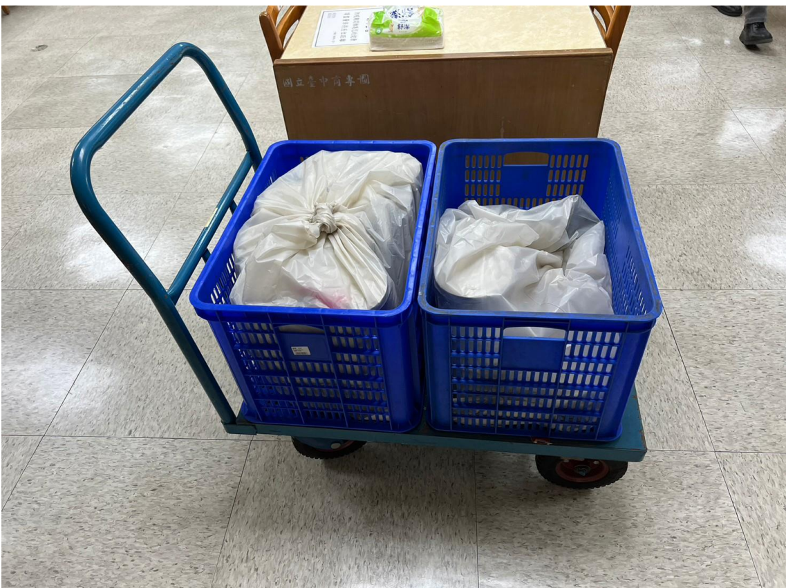
以推車將便當送至會議場地