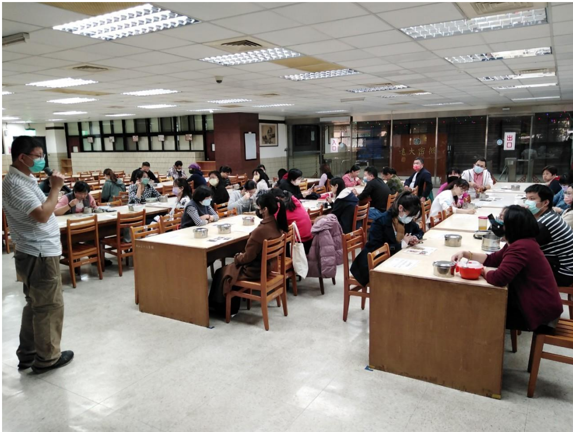
廠商說明訂購流程