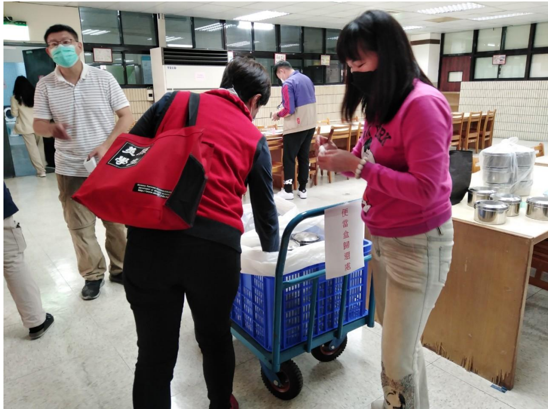
循環容器便當盒現場回收