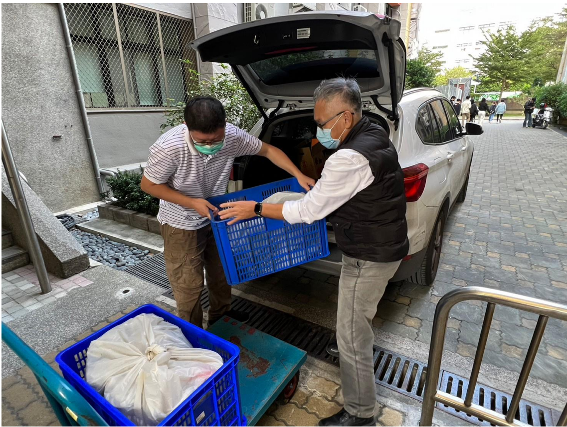
以推車搬運循環容器金屬盒盛裝的便當