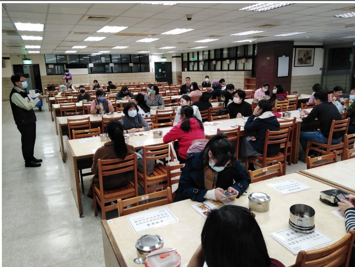
法規說明、經驗分享、實務觀摩及 Q&A