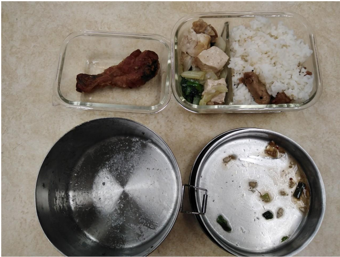
自備可重複清洗容器到場盛裝餐點