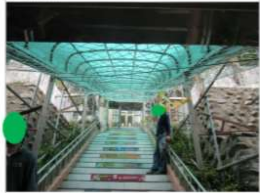
照片 1 樓梯採光罩下方已設置安全網。