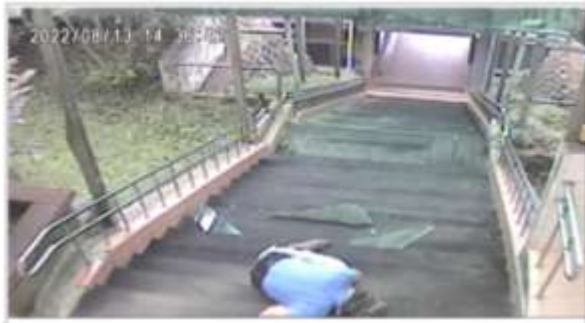
照片 2 監視器拍攝到罹災者李○○墜落時之畫面，李○○未確實使用安全帶、安全帽及其他必要之防護具。