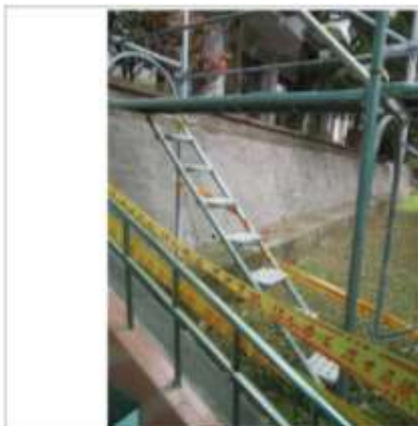
照片 3 樓梯採光罩旁之施工架已設置安全上下設備。