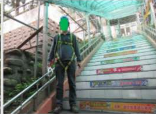
照片 6 施工人員穿著之背負式安全帶(雙掛勾)