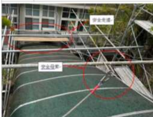
照片 4 樓梯採光罩上方已設置安全索及安全走道。