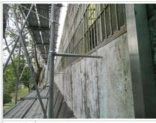
照片 5 樓梯外牆之施工架已設置壁連桿。