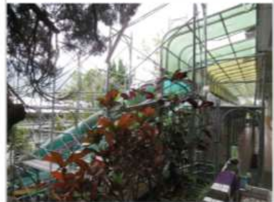
照片 2 樓梯採光罩中已設置施工架。