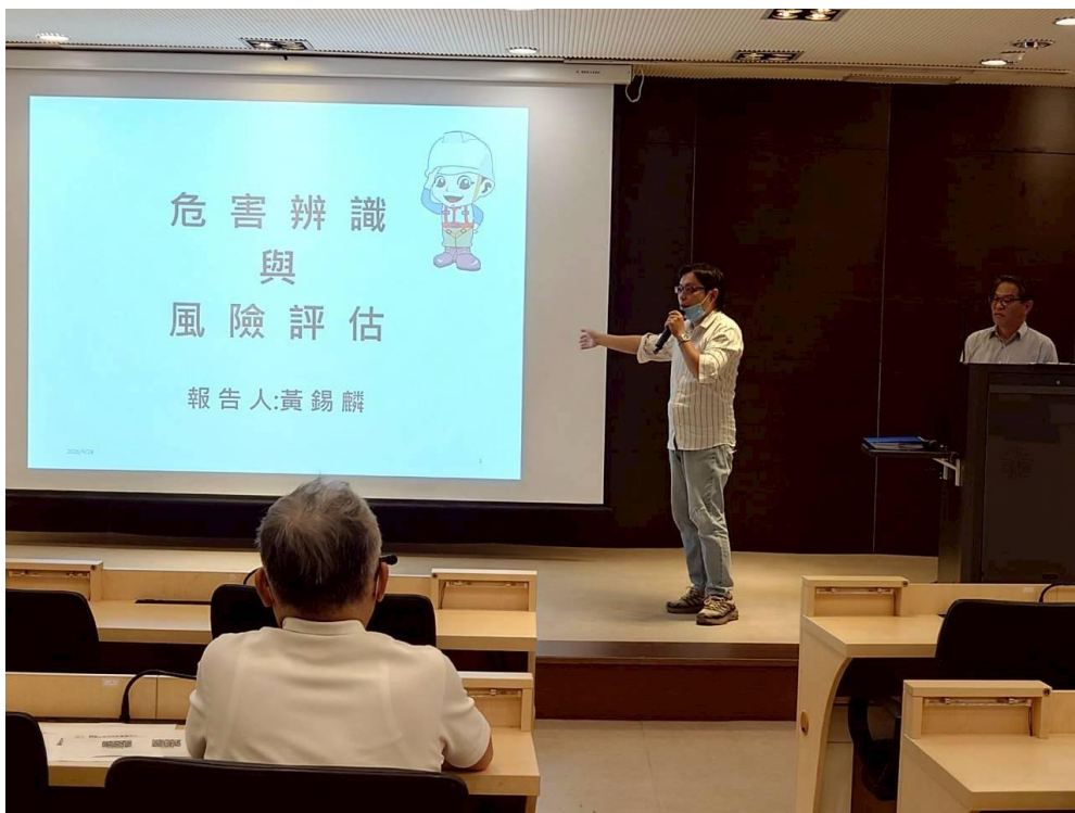
職災重建中心承辦介紹課程