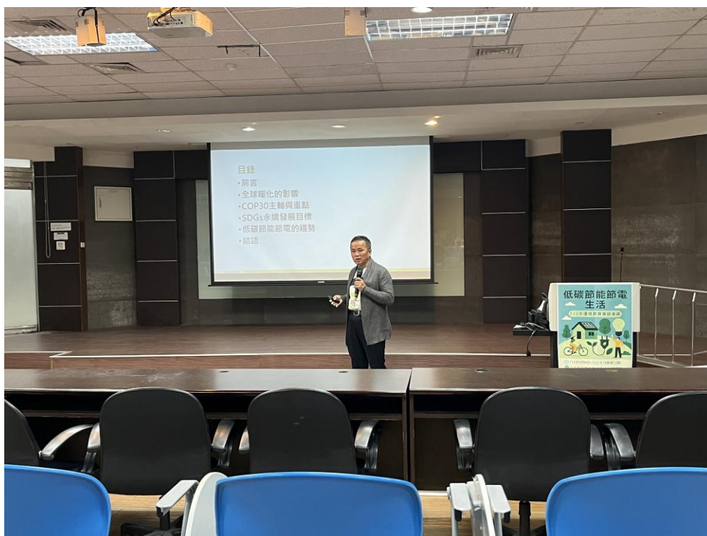
講師介紹今日課程大綱