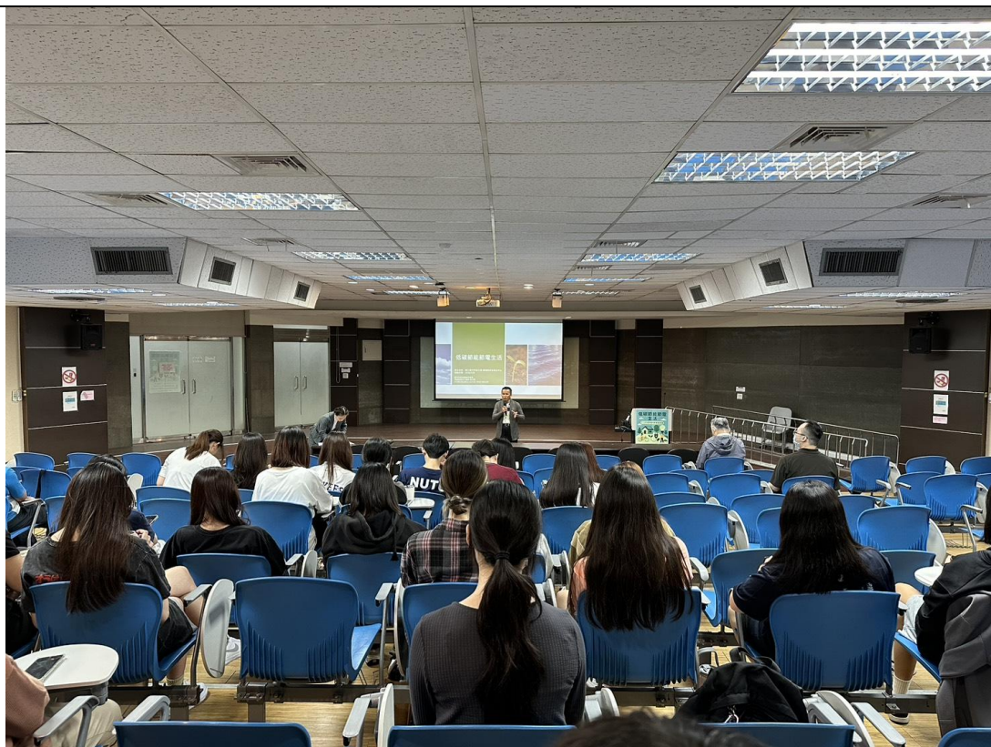
教職員工生聆聽演講