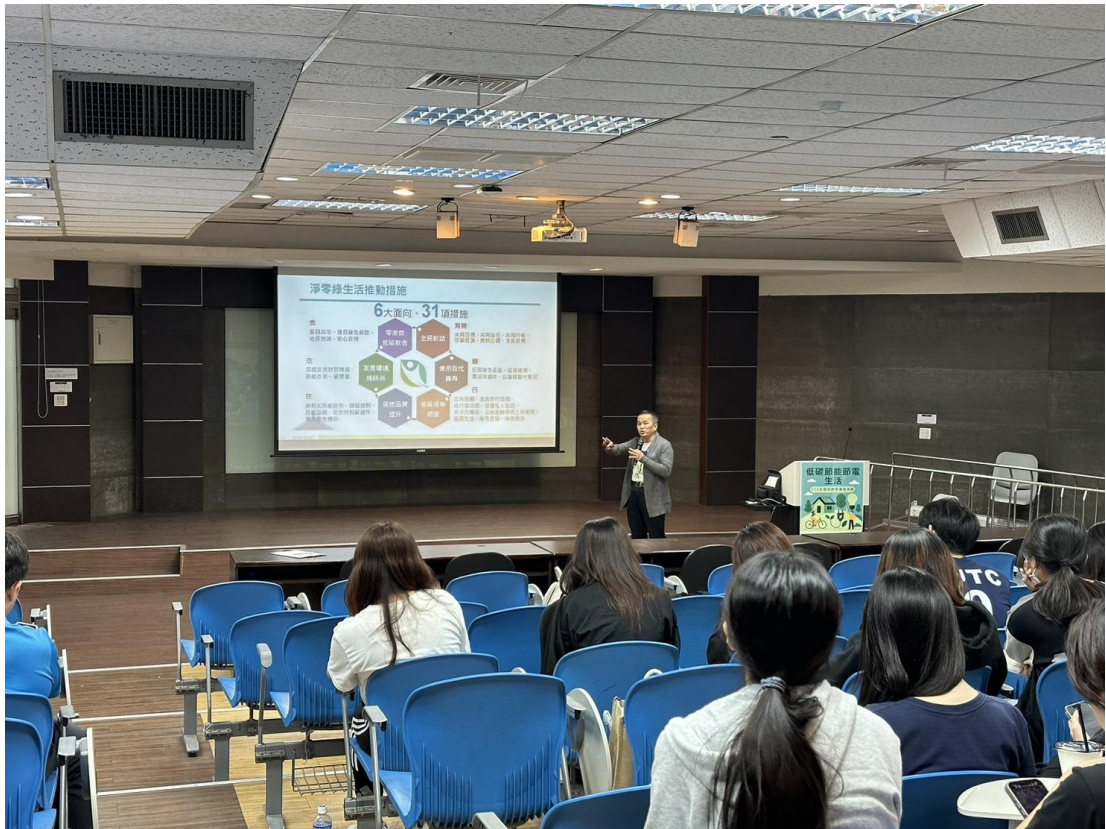
講師介紹淨零綠生活推動措施